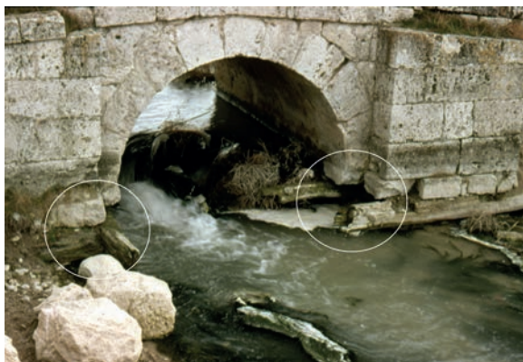
Fig. 15. Puentecilla de Roa, aguas abajo, arco 3.º, por Antolín Rodríguez, año de 1783. Señalado con círculos blancos el posible maderamen sobre el que se asienta el puente, citado por la documentación (fotografía de Juan José Moral Daza, 1981).

Configuración arquitectónica. Destaco de ella las siguientes características. Es un puente de pequeñas dimensiones, como requiere la corriente de agua que tiene que salvar. Está construido en su conjunto con buena piedra de sillería, sin apenas presentar desgaste. La calzada es alomada en “lomo de anguila”, empedrada y presenta desgaste por el uso. Tiene tres arcos de medio punto: el central de mayores dimensiones (en luz y flecha) que los laterales., fundados sobre dos anchas pilas. Presenta dovelas de una rosca; dos tajamares, con corte en ángulo agudo, que se prolongan hasta la calzada; dos espolones, con corte rectangular, de poco saliente (el ancho de un sillar); estribos y manguardias potente; antepechos o pretiles de sillería, la mayoría, en su altura, de una sola pieza. Se aprecian restos de maderamen, sobre el que parece que descansan las pilas. Posee buenos materiales y buena técnica de construcción, su estructura es uniforme, armónica, sin añadidos, sin reparos accidentales, salvo la reposición de algunas piezas del pretil, caídas o tiradas a la corriente. Se conserva bien y puede decirse que la puentecilla de Roa es «un puente monumental en miniatura».