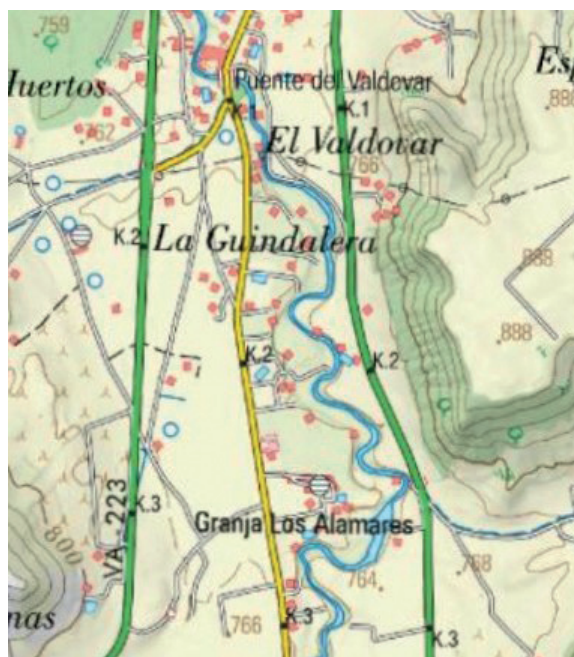
Fig. 2. Vista del río Duratón, aguas arriba del puente de Valdovar. Nos fijamos en los "curvas" o meandros, tan cerrados, de su cauce.