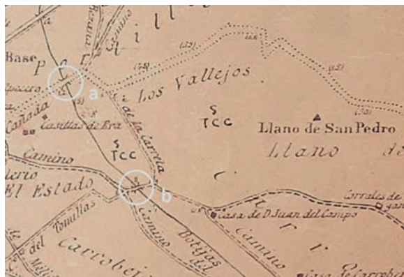
Fig. 12. Sección de un plano de Peñafiel, del año 1903. Dirección General del Instituto Geográfico y Estadístico. AHPV, O. P. Entre círculos blancos: a) Puentecilla de Roa, b) Puentecilla de Carrovejas; sobre el arroyo Botijas.

Por tanto: *butti(a) + -culas = botijas . ¿Qué significa esta palabra en el contexto geográfico en cuestión? Significa 'exurgencia', 'agua que semeja hervir', 'agua que bulle', 'qué sale a borbotones'; en diminutivo. ¿A que nos recuerda esto? A la exurgencia; al nacimiento, en el suelo, del Botijas; al topónimo Las Madres. Es, pues, un hidrónimo onomatopéyico. Topónimos relacionados: Botija (pueblo de Cáceres), Barranco del Botijo (Albarracín, Teruel), La Botija (Tejerina, León), El Botijo (Fermoselle, Zamora), Botijeras (Riosequillo, León), Botijeras (San Pedro de Moarves, Palencia), Las Botijeras (Celada de Cea, León), Las Botijeras (Amusquillo, Valladolid), Las Botijuelas (Renedo de Valtuéjar, León), Fuente del Boto (Medina de Rioseco, Valladolid), Umbría Botano (Albarracín, Teruel) y muchos más.