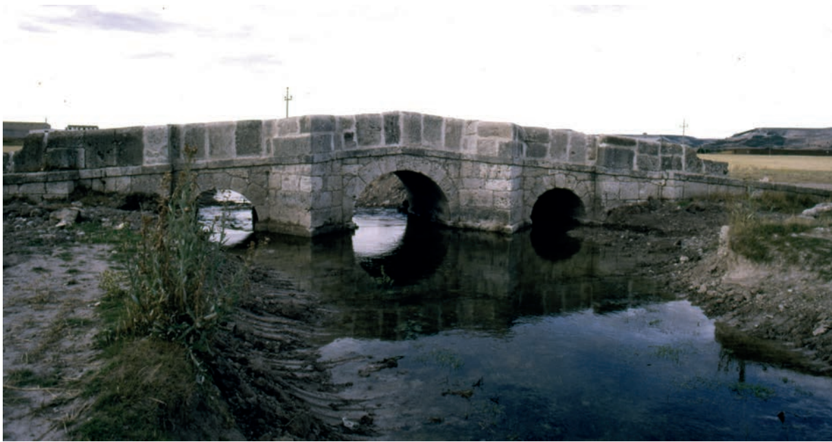
Fig. 13. Puentecilla de Roa, aguas arriba, por Antolín Rodríguez, año de 1783. Observamos la uniformidad y armonía total del edificio (fotografía de Juan José Moral Daza, 1986).

tecillas aparece, de forma más o menos genérica, en todas las escrituras que le relacionan con Peñafiel 48 . Quiero detenerme en dos de ellas. De las que luego sacaré conclusiones. Ambas son cartas «de poder».