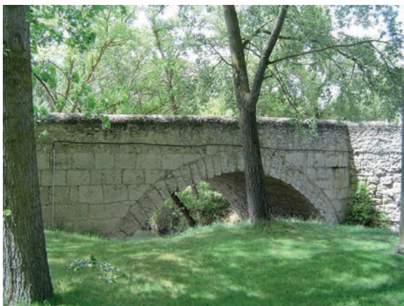
Fig. 3. Vista parcial del arco románico, aguas arriba. Con la mandargia y tímpanos reformados por Diego de la Riba, en 1740.

Vestigios arquitectónicos. Si tenemos en cuenta la configuración del terreno y, en concreto, la distancia entre márgenes, el puente románico del Valdovar debió de disponer originariamente de tres arcos de medio punto, con dos pequeños tajamares, en ángulo agudo, que no se prolongaban hasta la calzada. Es muy posible que careciese de espolones. Tal vez la calzada era de doble rasante —en “lomo de anguila”—. Este edificio pudo ser