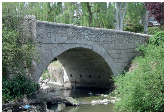
Fig. 8. Arco 3.º, aguas arriba, de los hermanos Alonso de Estrada y Francisco de Araviñas, c. 1677.

Una vez comenzada la obra a los maestros se les presenta un grave problema: al querer fijar la cepa