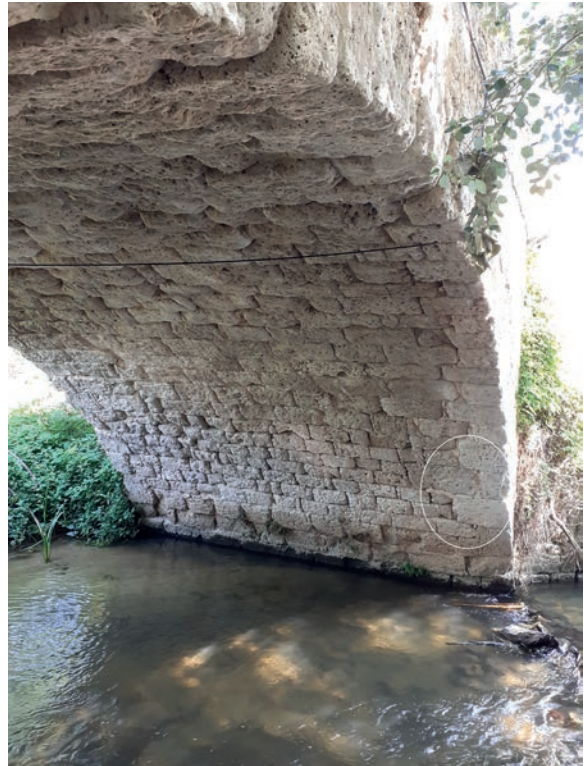
Fig. 4. Vista del intradós del arco románico, aguas arriba, siglo XII. Señalados con círculo blanco algunos de los aristones incrustados por Diego de la Riba, en 1740.

similar al primitivo puente de Ávila, al que puse como ejemplo para describir el paso del Duero.