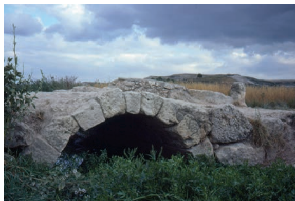
Fig. 17. Puentecilla de Carrovejas, aguas abajo, poco antes de su destrucción (fotografía de Juan José Moral Daza, 1977).

Solo doce días después, el concejo y vecinos del pueblo, mediante «foro perpetuo» (contrato de lar-