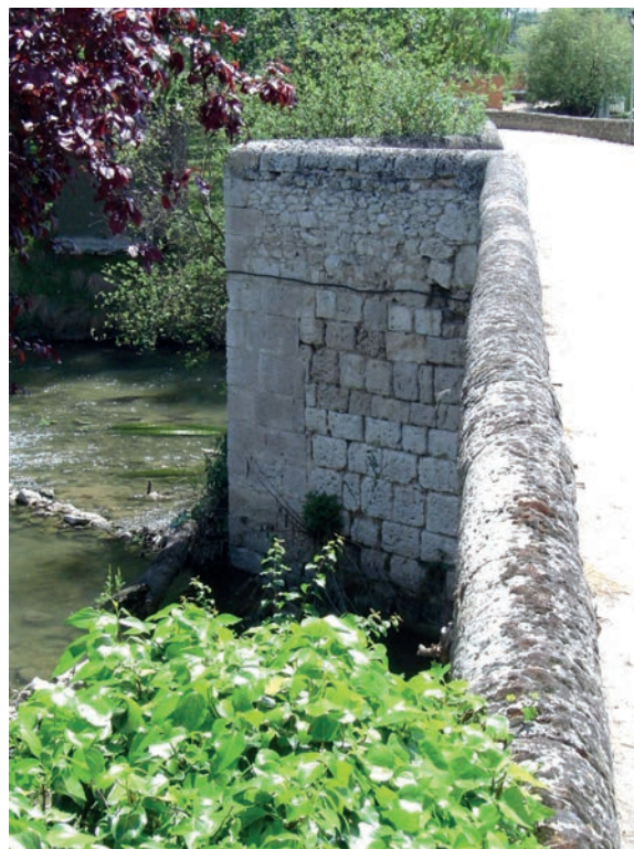
Fig. 10. Tajamar 2.º, con incrustaciones de piedras nuevas en la arista, por Diego de la Riba (?), 1740.

Pero, en 1735, el deterioro de los edificios era alarmante. Parece que el municipio, por sí solo, no podía hacerse cargo ya de las obras. Por eso, el 24 de abril de ese mismo año, se dirige al Consejo de Castilla y manifiesta dicha circunstancia. Le pide que atienda sus peticiones y provea el arreglo de sus edificios. Añade, además, que, a la hora de repartir su coste, se incluyan