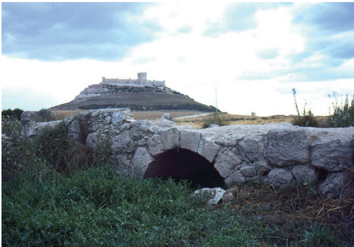
Fig. 16. Puentecilla de Carrovejas, aguas arriba, poco antes de su destrucción (fotografía de Juan José Moral Daza, 1977).

la repoblación dicha expresión era, más o menos, sinónima de casar , villa , quintanilla , ecclesia , monasterium y otras, entendiéndolas siempre como «unidades de poblamiento y de explotación agraria». Estas minúsculas conglomeraciones humanas dieron lugar, en ocasiones, a aldeas; en otras, no: quedaron como simples heredades, con gente o sin ella, y se solían arrendar. En nuestro caso concreto, la propiedad fue laica. En tiempo de don Juan Manuel, la Casa de la Reina pertenecía al señor, y la entrega al convento de San Juan. Es de suponer que don Juan Manuel la heredase de su padre, don Manuel, y que este, a su vez, la adquiriese de manos del futuro rey Sancho IV, cuando le donó la villa de Peñafiel y su tierra. En resumen: dicha heredad pertenecía, con expresión de la época, a «palacio». ¿Y por qué el nombre de Reina ? Lo desconozco. Pero es muy probable que, en un tiempo anterior a Sancho IV, la hacienda la disfrutase, de por vida, alguna de las reinas que tuvieron la tenencia de Peñafiel, que fueron varias. Después de su muerte, retornaba a la Corona. Hasta aquí los antecedentes de esta casa . Veamos a continuación cuál fue su devenir histórico. Adelanto que esta hacienda no era una “tierrecilla”: sabemos que, a principio del siglo XIX, tenía una extensión de 180 fanegas de sembradura, es decir, unas 46 ha. Ocupaba buena parte del actual pago de Carrovejas.