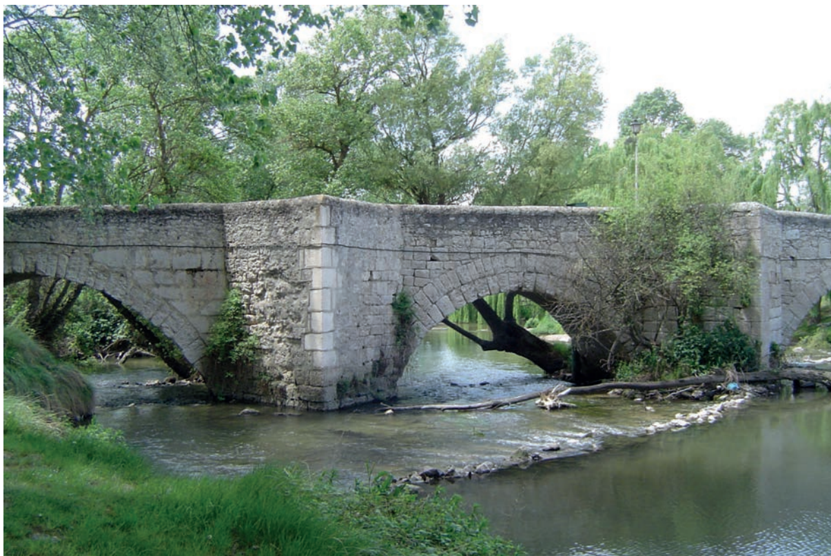
Fig. 1. Vista general del puente, aguas arriba (fotografía del autor, 2005).

del reino. En la misma tierra de frontera, denominada a partir de ahora Extremadura 'los extremos', cristaliza un nuevo tipo de gentes que recibe de manos del rey un estatuto que les permite organizar sin grandes restricciones su vida social, política y administrativa. En este espacio, debemos incluir, entre otros, los territorios de Peñafiel, Curiel, Roa, Fuentidueña y Cuéllar. Esta organización ya es una realidad hacia la mitad del siglo XII: se generan las comunidades de villa y tierra . Peñafiel es una de ellas. La villa es el centro y eje de la comunidad: núcleo de una población con aspiraciones urbanas, poseedora de castillo y murallas, conformada por trece barrios, cuyos nombres asumen el de sus respectivas parroquias. La tierra está constituida por una serie de aldeas, sobre las que el concejo de la villa ejerce todos los derechos de propiedad y organización 3 .