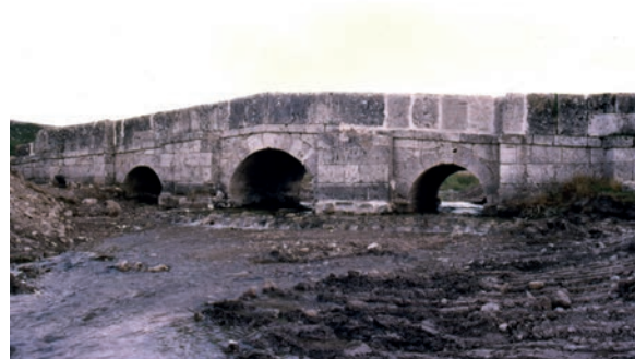
Fig. 14. Puentecilla de Roa, aguas abajo, por Antolín Rodríguez, año de 1783.

Pero, de inmediato nos surge una pregunta: ¿dicha puentecilla se reparó o se construyó ex novo por Antolín Rodríguez o los canteros citados? Para dar una respuesta satisfactoria es necesario, como dije más arriba, estudiar también la estructura del edificio y contrastar los datos inferidos con los diplomáticos que acabo de exponer.