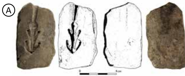
Fig. 3. (A) Dibujo y fotografía del molde. (B) Detalle y positivo obtenido del molde. Museo de Burgos.

bre él algunos restos de viga quemada. Los materiales arqueológicos encontrados sobre el suelo fueron los siguientes: fragmentos de un vaso globular celtibérico pequeño, otro idéntico mediano, una ollita, una cuenta de collar de bronce, un arete de bronce, un fragmento de una pequeña pieza de bronce con calados, dos cupulitas de bronce unidas con sendos garfios para enganchar, un cuerno de bóvido con el arranque de la testuz junto a un candil de asta de ciervo, un mango de asta de ciervo, dos fragmentos de sendos molinos circulares diferentes (uno de arenisca y otro realizado en caliza), diversos huesos de fauna de mediano y gran tamaño y el molde que estudiamos en este trabajo (fig. 3).