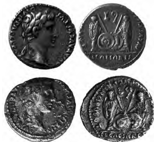
Denarios de plata de Augusto (RIC, I 2 , n.º 207) hallados durante las excavaciones realizadas en el poblado de Las Quintanas (Padilla de Duero, Peñafiel).