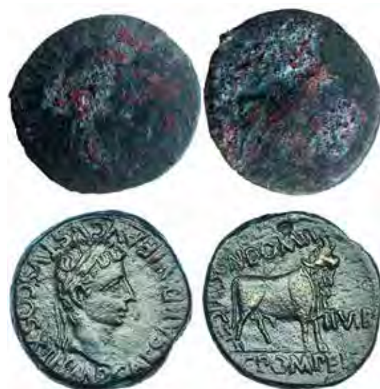
Arriba, as de bronce de la Colonia Iulia Victrix Celsa recuperado en el poblado de Las Quintanas durante la campaña de excavaciones del año 2003; debajo, otro as de la misma emisión (RPC, I, n.º 278).