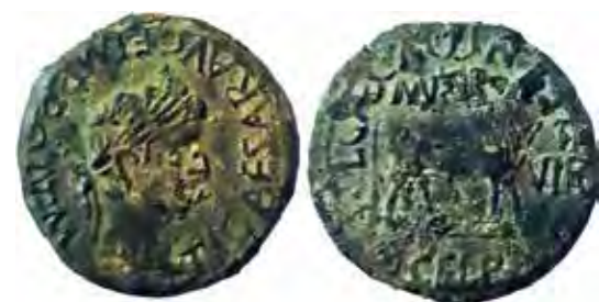
As de bronce de Tiberio (14-37 d. C.) emitido por la ceca de Turiaso (RPC, I, n.º 419), recuperado durante las excavaciones en el poblado de Las Quintanas.

Como testimonio del numerario de época de Augusto llegado hasta el oppidum vacceo-romano de Las Quintanas, debe añadirse a estas piezas de plata un as de bronce, en muy mal estado y hasta ahora inédito, que fue localizado durante la campaña de excavaciones del año 2003; el mismo pertenece a una emisión de la Colonia Iulia Victrix Celsa