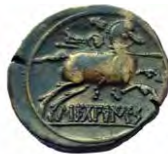
Reverso del tipo Sekobirikes n.º 10: jinete armado con lanza y casco vistiendo clámide, con leyenda ŠEKOBIRIKES sobre el exergo, en un denario del primer tesoro de Padilla (Museo de Valladolid).

La descripción incluida en la noticia periodística permite una fácil identificación. Las piezas halladas en Padilla de Duero pertenecían al tipo Sekobirikes n.º 10, según la clasificación de Villaronga (1994: 292), pues las series Sekobirikes n.º 5-9 muestran en su anverso los mismos motivos que aquella, pero Sekobirikes n.º 10 es la única en cuyo reverso el jinete aparece vistiendo una clámide. Este tipo se incluye en la 3.ª emisión de García-Bellido y Blázquez (2001: 340), la