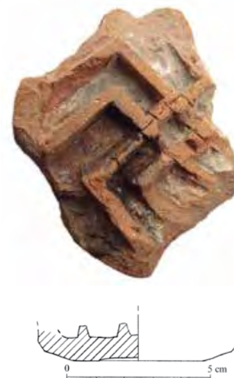
Fragmento de Cauca .

De su morfología nada podemos decir con seguridad. Por paralelismos de los que seguidamente hablaremos, lo más probable es que estemos ante una forma semiabierta, de tipo cuenco profundo con la base plana o de marmita