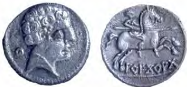
Denario de Arekorata

ceden la mayor parte de las monedas hispanolatinas que aparecen en territorio vacceo. Muy raras, e incluso únicas en algún caso, son las de otros talleres, como Segobriga (Saelices, Cuenca), Ercauica (Cañaveruelas, Cuenca) o Iulia Traducta (Tarifa, Cádiz). Y absolutamente excepcional es un as de los magistrados C Lucien y C Muni Q. acuñado en Valentia (Valencia) que se halló en Cauca durante la concentración parcelaria, en 1949. Como puede verse, son de nuevo los talleres del valle del Ebro los más activos en el abastecimiento de moneda al centro de la Submeseta norte, a los que habría que sumar Augusta Emerita , si bien sólo en virtud de las emisiones