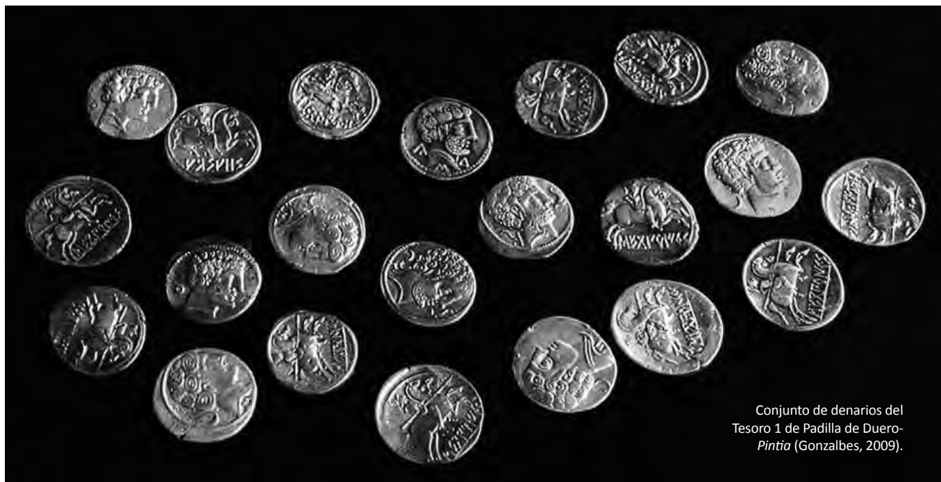
Conjunto de denarios del Tesoro 1 de Padilla de Duero-Pintia (Gonzalbes, 2009).