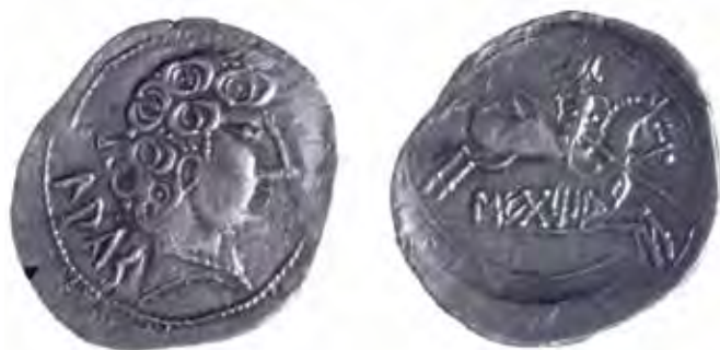
Denario de Sekotia Lakas.

midad. Más alejada, pero con una gran capacidad emisora también, la ceca de Turiasu (Tarazona, Zaragoza) también está muy presente, de nuevo tanto en los tesoros como en los hallazgos. Y en ambos casos son sobre todo sus denarios, más que los bronceos, los que con más frecuencia se constatan. Exceptuando Arekoratas —situada quizá en La Rioja baja (F. Burillo), puesto que su reducción con Luzaga (Guadalajara) cada vez parece más improbable—, cuyas monedas superan el centenar y, por tanto, se sitúan en un escalón cuantitativo intermedio, el resto de cecas celtibéricas, como Sekaisa , Belikiom (zona del río Aguasvivas, Zaragoza) Kontebia/Kontebakom Bel (Botorrita, Zaragoza), Sekotia Lakas (¿Langa de Duero? Soria), Uarakos (¿La Custodia? Viana, Navarra), etc., obtienen una representación muy modesta, ya que ninguna de ellas alcanza la decena.