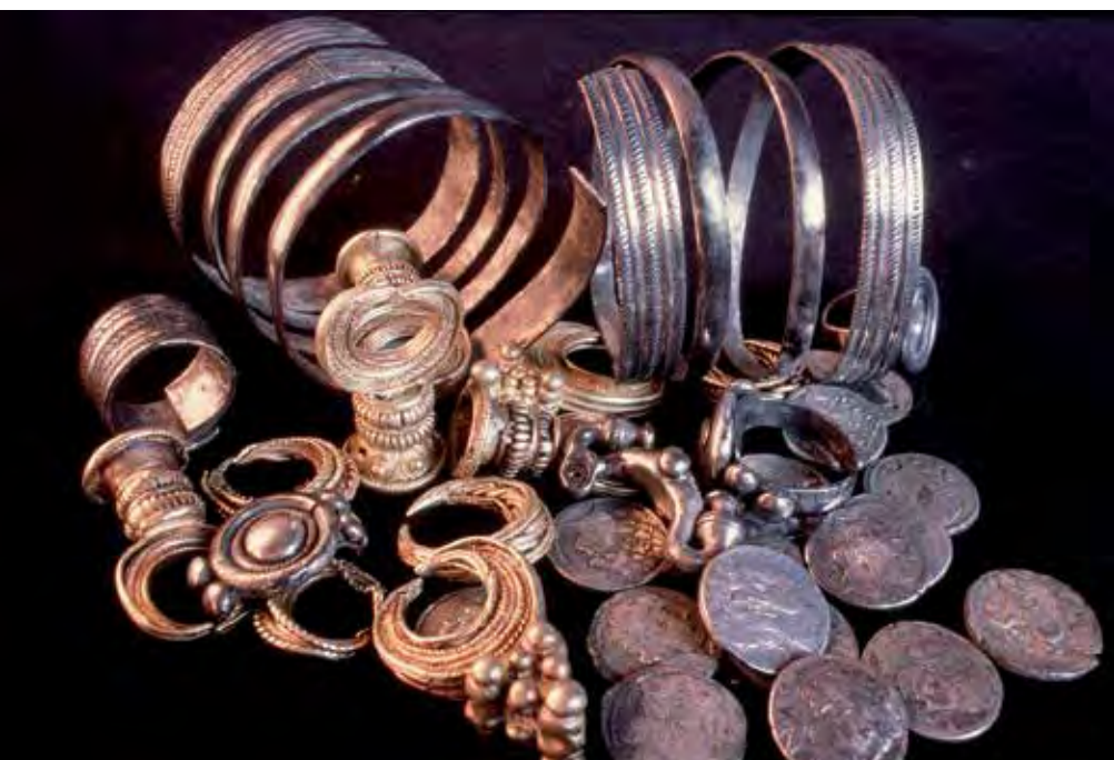
Tesoro 2 de Padilla de Duero- Pintia.

Calagurris (Calahorra, La Rioja), Caesaraugusta (Zaragoza), Turiaso (Tarazona, Zaragoza) y Bilbilis (Calatayud, Zaragoza), son las cecas de las que pro-