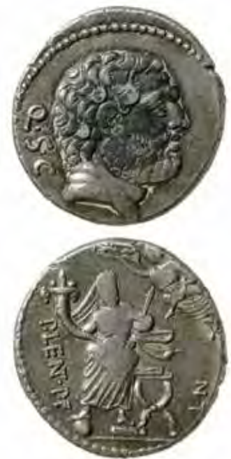
Denario romano republicano del tesoro de Pallantia/Palenzuela , con cabeza de anverso de tipo celtibérico, fechado en 74 a. C. (Gonzalbes, 2009).

Ese aumento del tráfico comercial también se manifiesta en el hecho de que a algunas ciudades vacceas llegó incluso moneda acuñada en talleres del sur peninsular, a partir de finales del siglo II a. C. Nuevamente de Cauca procede un as de Obulco (Porcuna, Jaén)