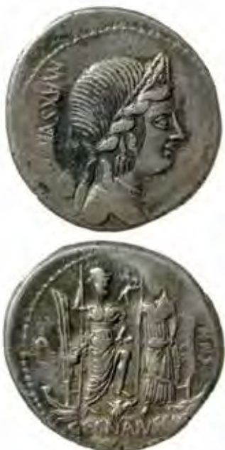
Denario romano republicano del tesoro de Pallantia/Palenzuela , fechado en 75 a. C. (Gonzalbes, 2009)

No obstante, conviene matizar esta idea que vincula las especies bron-