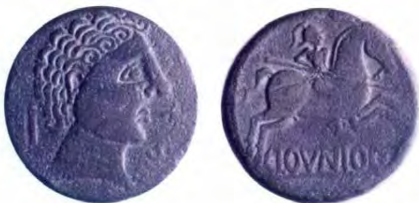
As hispanolatino de Clounioco (Clunia)