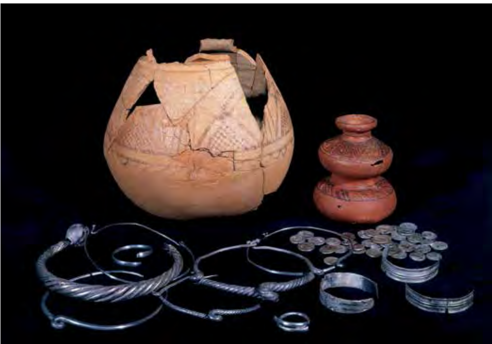
Tesoro Palencia 3, también llamado de Las Filipenses.

datos también sobre la incidencia de las acuñaciones romanas republicanas, aunque la casuística de éstas es muy variopinta; y datos, finalmente, sobre el grado de desgaste de las piezas, un