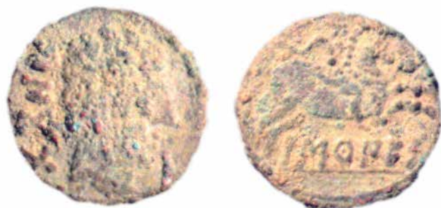
Denario de Baskunes perteneciente al Tesoro 4 de Padilla de Duero-Pintia.