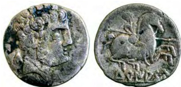
Denario de Turiasu , del tesoro Palencia 3 (Gonzalbes, 2009).