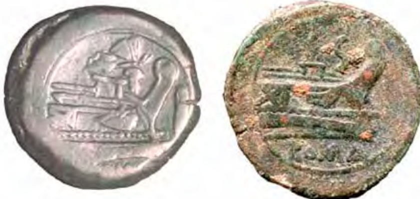
Reversos de dos ases romanos republicanos hallados en Cauca , fechados entre 169 y 158 a. C..

Porcentualmente constituye una pequeña parte de la moneda constatada en territorio vacceo. En los tesoros es muy rara y las pocas piezas que se conocen proceden de hallazgos aislados. Ya en 1985 M. H. Crawford llamó la atención sobre la escasez con la que llegaba a Hispania la moneda romana republicana, sobre todo entre el 137 a. C. y la época de Sertorio (82-72 a. C.), y esto se ve bien reflejado en el centro del valle del Duero. Aquí, por otra parte, se cumple otra característica: la proporción entre la plata y el bronce es de 2 a 1, si bien la muestra que manejamos es tan poco representativa (40 piezas) que el valor de este dato tiene un alcance muy limitado. A pesar de ello, tiene su significación, ya que nos aproxima mejor a la