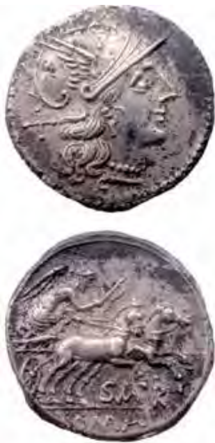
Denario romano republicano con cabeza de Dea Roma en anverso y Victoria conduciendo una biga en reverso.

composición del material circulante que los tesoros, pues estos traducen que a las élites urbanas vacceas no les interesa acumular bronce, sino plata, y en las pequeñas transacciones que se realizan en cualquier cultura de la Antigüedad se usa más la moneda de base cobre que la acuñada en metales preciosos.