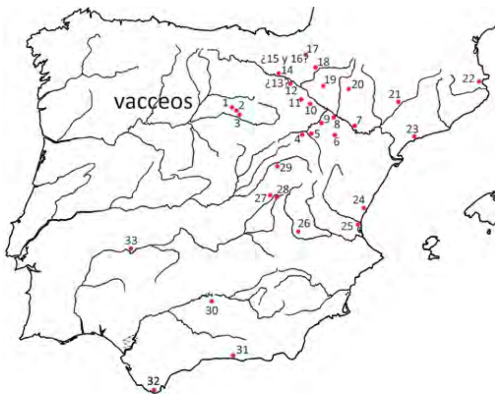
Localización de las cecas hispánicas con representación en territorio vacceo. 1, Sekobirikes ; 2, Kolounioku ; 3, Sekotia Lakas ; 4, Bilbilis ; 5, Sekaisa ; 6, Belikiom ; 7, Kelse ; 8, Salduie/Caesar Augusta ; 9, Konterbia/Kontebakom Bel ; 10, Bursau ; 11, Turiasu ; 12, Calagurris ; 13, ¿ Arekoratas? ; 14, ¿ Uarakos? ; 15, ¿ Bentian? ; 16, ¿ Oilaunu/Oilaunes? ; 17, Baskunes/Baraskunes ; 18, ¿ Arsaos? ; 19, Sekia ; 20, Bolskan ; 21, Ilirta ; 22, Untikesken ; 23, Kese/Kesse ; 24, Arse ; 25, Valentia ; 26, ¿ Ikalesken? ; 27, Segobriga ; 28, Konterbia Karbica ; 29, Ercavica ; 30, Obulco ; 31, Sexs ; 32, Iulia Traducta ; 33, Augusta Emerita .

detalle importante para aproximarnos al tiempo medio que transcurre entre la fecha de acuñación y la de su salida de la circulación. En lo que en absoluto los tesoros reflejan la realidad económica