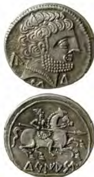
Denario de Turiasu , del tesoro de Pallantia /Palenzuela (Gonzalbes, 2009).