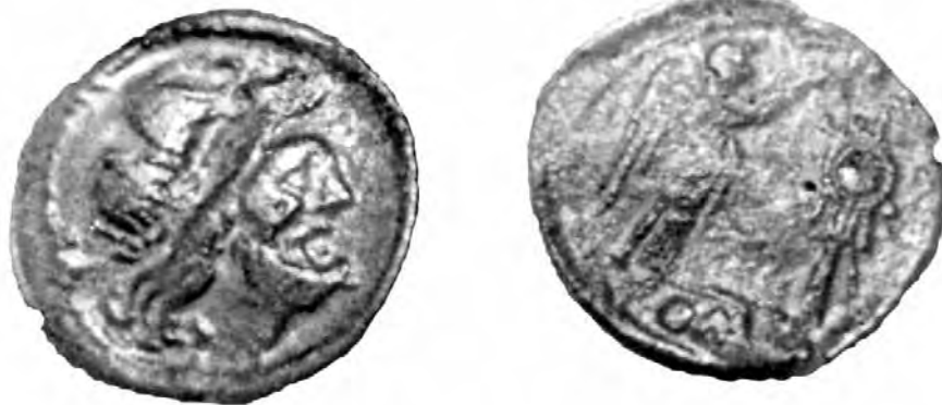
Victoriato hallado en Cauca , con cabeza de Iovi en anverso y Victoria coronando un trofeo en reverso, acuñado en Roma entre los años 217 y 197 a. C. (calco con prensa de Codera).

Durante las fases iniciales de la segunda Edad del Hierro, en las relaciones de intercambio que realizaron los vacceos el trueque hubo de ser el sistema empleado. Mediante estimaciones aproximadas del valor de las mercancías se intercambiaban todo tipo de productos tanto en el marco del comercio local como en el del interurbano y el que desarrollaron con ciudades de entidades étnicas vecinas. Será a partir de finales del siglo III a. C., y en algunos casos a partir de inicios de la centuria siguiente, cuando empezarán algunos vacceos, desplazados de sus lugares de origen, a ver físicamente las primeras monedas y a darse cuenta del uso que de ellas se hacía en ambientes alejados de sus ciudades natales y en contextos económicos por completo ajenos a su cultura. Con esto queremos decir que es posible que, más que los comerciantes de las ciudades vacceas, fueran los guerreros al servicio de los ejércitos cartagineses, romanos e incluso ibéricos, los primeros en tener en sus manos monedas, púnicas y romanas, lógicamente; los primeros en llevarlas a sus respectivas ciudades como cobro de los servicios prestados y quizá también como parte de los botines obtenidos tras la destrucción del enemigo. Esta idea, que no deja de ser más que una suposición, está cimentada en lo que algunos autores clásicos refieren sobre la participación de