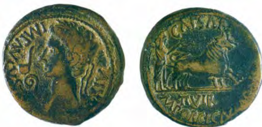
As hispanolatino con efigie de Augusto, de la ceca de Caesaraugusta (foto, MAN).

Las monedas que pasaron a formar parte de muchos de los tesorillos vacceos es de suponer que tendrían un origen diverso. Asumido el hecho de que quienes los reunieron fueron personas del más alto rango social y económico en las ciudades vacceas, es indudable que algunas de ellas son monedas sacadas de la circulación en el contexto de las transacciones comerciales que llevarían a cabo con las élites de otras ciudades, ya fuesen vacceas también, celtibéricas, vettonas o ibéricas. Otras, serían monedas cuyo origen estaría en los regalos que presumiblemente se hacían entre las élites. Una tercera fuente hubo de ser la recepción de pagos por servicios militares prestados en calidad de mercenarios de ejércitos ibéricos, romanos, púnicos o incluso de otras etnias y ciudades meseteñas. Y en este contexto de guerra no debemos descartar una cuarta posibilidad: que parte de las monedas de los tesorillos vacceos tuvieran un origen en los botines. Esta diversidad de circunstancias que pueden concurrir en la formación y composición de un tesorillo es lo que explica por qué las monedas presentes en ellos no reflejan la dinámica económica de una ciudad o