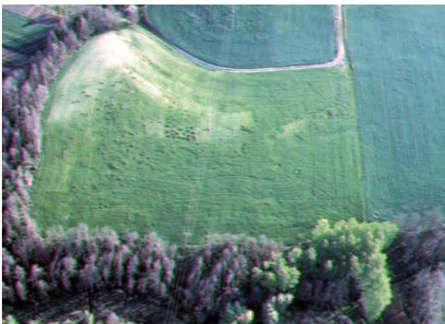
Fotografía del área de Llantada, con concentración de silos (fotografía Sanz y Velasco, 2003).

Muy cerca de las casas de Llantada, aunque en la margen izquierda del arroyo, existe otro despoblado medieval, cuya necrópolis ha sido excavada. A mi entender, y con los datos de que dispongo, este cementerio correspondería a la iglesia —luego convertida en ermita— de San Bartolomé, iglesia perteneciente a una aldea cuyo nombre, por ahora, desconozco. También, a 1,25 km de San Bartolomé, aguas abajo del Duero, se encuentra el pago de Sanchidrián o Santidrián (San Cipriano). Ignoro si existen en el lugar restos arqueológi-