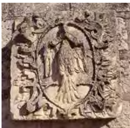
Escudo en piedra con águila coronada, con las alas abiertas, y en el pico la divisa LIBERTAS , colocada hoy junto a la Fuente de La Garza, Calle del Corralillo.

En este interregno de indefinición jurisdiccional, se erige el nuevo templo, del primer periodo renacentista, en el que se colocan, cara al exterior, tres grandes escudos en piedra, luciendo, entre otros detalles, un águila coronada, con las alas abiertas, y en las garras o en el pico la divisa LIBERTAS , en alusión sin duda a la charta libertatis o privilegio de exención que pretendía tener San Salvador. Antonio Matabades, en sus Memorias de la villa de Peñafiel (1797), todavía nos recuerda que dicha iglesia tiene particular escudo de armas.