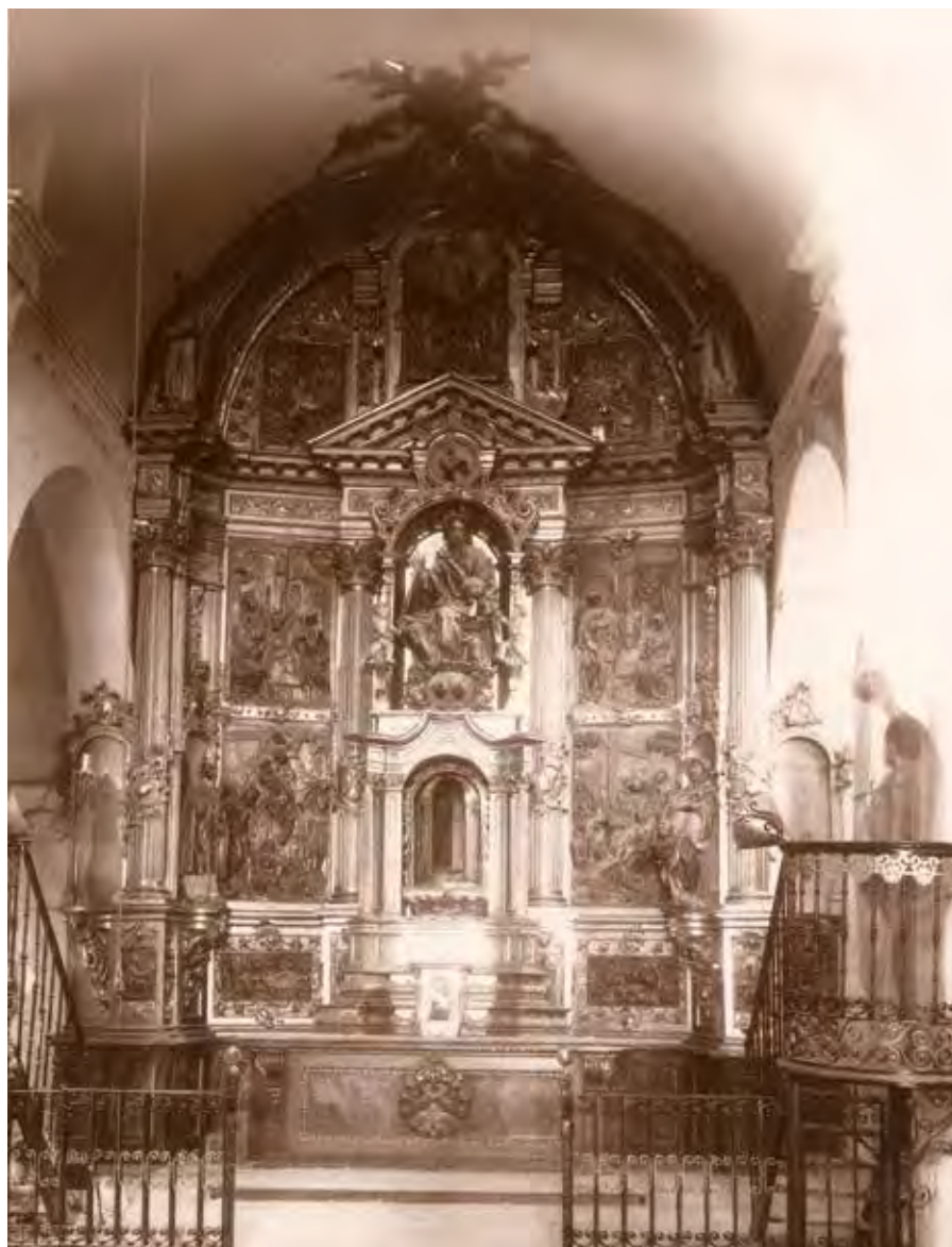
Presbiterio y retablo mayor de San Salvador, c. 1959.

monarca confirma a San Servando y San Salvador, el resto de heredades —las monásticas—, con los mismos privilegios que habían disfrutado hasta entonces.