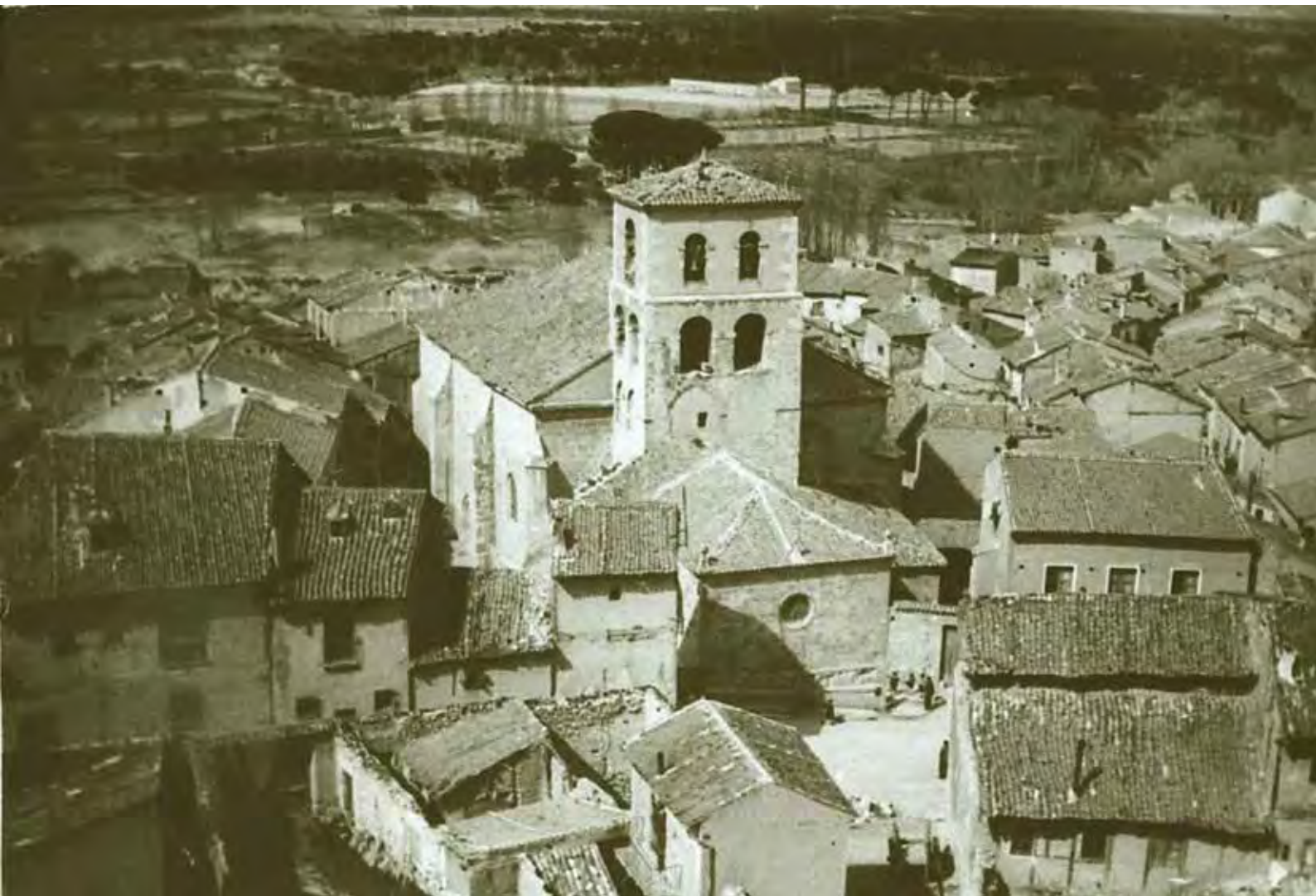
San Salvador de los Escapulados (Foto Miguel, c. 1959. Colección de Juan José Moral Daza).

complejidad que encierra el concepto que intentan denotar. Su interpretación va a depender de múltiples factores: momento de su fundación, origen de sus pobladores, tipo de familia que los pueblan, si disponen o no de estructuras defensivas, si están sujetos a un superior religioso o laico... Pero, casi todos ellos participan de unos rasgos comunes: son de tamaño reducido —una familia, cinco, veinte—; muy numerosos —al menos el doble de los que hoy conocemos para un mismo espacio—; no jerarquizados entre sí; muy inestables —algunos desaparecen pronto, de otros sólo se conserva su iglesia—. Lo que es innegable es que la aldea —con este apelativo genérico, por comodidad, los designaré en adelante—, como cualquier entidad histórica, sufre un proceso de transformación a través del tiempo. No fue lo mismo, por ejemplo, una aldea primigenia, semejante a una “granja agrícola”, o una aldea/monasterio, que un