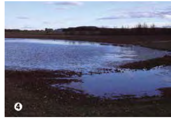
Fotografía del área suroeste de la Zona Arqueológica Pintia: 1. Ciudad de Las Quintanas. 2. Necrópolis de Las Ruedas. 3. Ustrinum de Los Cenizales. 4. La Laguna. 5. Llantada. 6. Necrópolis de San Bartolomé (?).

Edad Media tierras de cereales ( terrae, areae ) y huertos ( horti ). Estos huertos estaban situados en la zona rehundida de la ribera, en el paraje llamado, entonces, La Requejada y hoy, Las Huertas . Era un terreno muy apreciado; se regaba con las aguas del arroyo de La Vega a través de una acequia ( irriguum ), que corría por la parte baja del terraplén. Es de suponer que también existiría alguna viña, ciertos prados (quintanas) y, en las márgenes del río y del arroyo, álamos y olmos. En el siglo XII contaba también Llantada con una pesquera —presa en el Duero—; en principio, como el nombre indica, para facilitar la pesca, pero, a