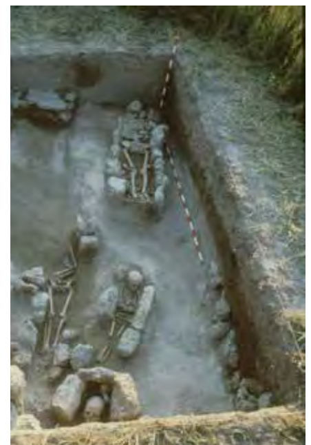
Necrópolis medieval del camino de La Aceña o San Bartolomé (?).