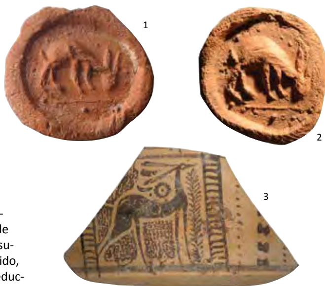
Representaciones de ciervas sobre cerámica de Montealegre (1, según J.F. Blanco), Tiedra (2) y Pintia (3).

cuero' contraponiendo cortes en 45° a punta de navaja, para crear cajitas, pies, mangos de simpula o pies anulares. Entre los hallazgos metálicos destacaremos un cuchillo ligeramente afalcatado que nos remite a una época en la que la metalurgia del hierro se aplica de forma generalizada para la creación de armamento y útiles de muy diversa naturaleza y función. Mangos de hueso para estos o para punzones metálicos también están constatados.