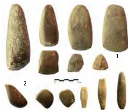
Hachas pulimentadas halladas en el cerro de La Ermita (1) y cantos pulidos para curtir, bruñir y afilar (2).

La aparición de unos amallobrigenses y de los caucenses en el texto de la tessera hospitalis hallada en Montealegre de Campos en 1985, no vino si no a complicar el asunto, como ya destacara R. Martín Valls, obligando a considerar que Amallobriga estuviera situada en Montealegre o, cuando menos, que el yacimiento en esa localidad asentado fuera atribuido a una de las gentilidades