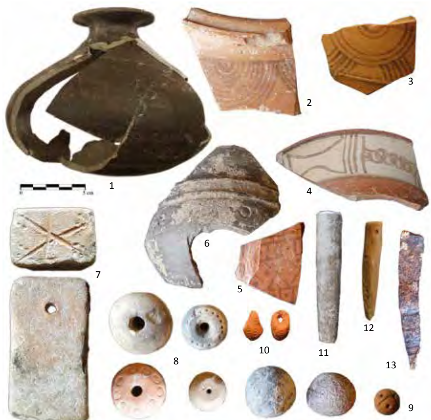
Cerámicas anaranjadas pintadas (1-5), gris cérea de imitación argéntea (6), pondus (7), fusayolas o contrapesos del huso de hilar (8), canicas de piedra y barro (9), colgante (10), mangos de punzones de hueso (11 y 12) y cuchillito afalcatado de hierro (13).

Los accesos a la Zona Arqueológica se realizan desde el casco urbano de Tiedra, desde el llamado 'camino viejo' —que nos conduce directamente al santuario de la Ermita— y el conocido como 'camino nuevo' que une la ermita con la población de Pobladura de Sotiedra, hoy adscrita al Ayuntamiento de Tiedra. Estas dos vías convergen en el santuario de la Ermita, que da nombre al yacimiento, aunque también forman parte del mismo, como ya queda dicho, los pagos de Alderete, Piedrahita, La Rana, Ceniceros y Hontanillas.