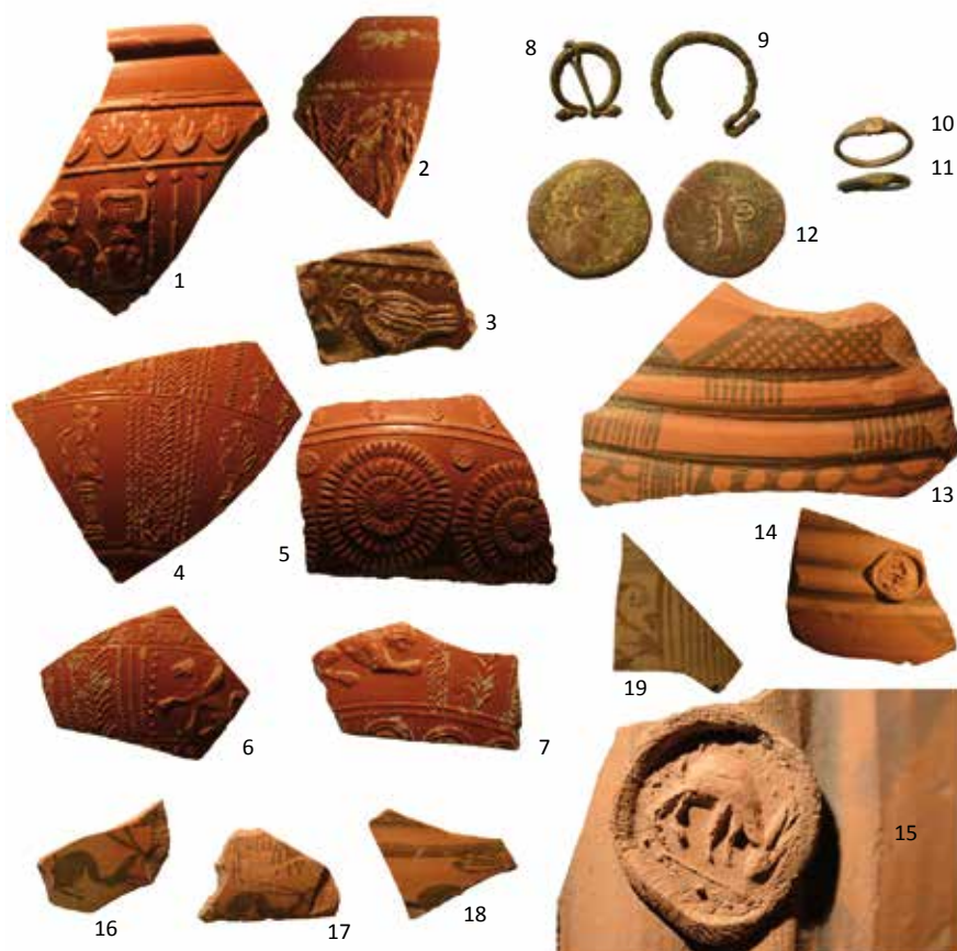
Producciones cerámicas romanas: terra sigillata (1-7), pintadas de tradición indígena (13-19); objetos en bronce: hebillas en omega (8 y 9), anillos (10 y 11) y as (12). Diferentes escalas.

La Ermita. Es el nombre con que se reconoce genéricamente el yacimiento arqueológico de Tiedra, pero en rigor el topónimo queda limitado al espacio entre los dos caminos que conducen al santuario. Presenta una pequeña elevación respecto al resto del yacimiento y registra abundancia de restos de materiales vacceos, altoimperiales y tardorromanos.