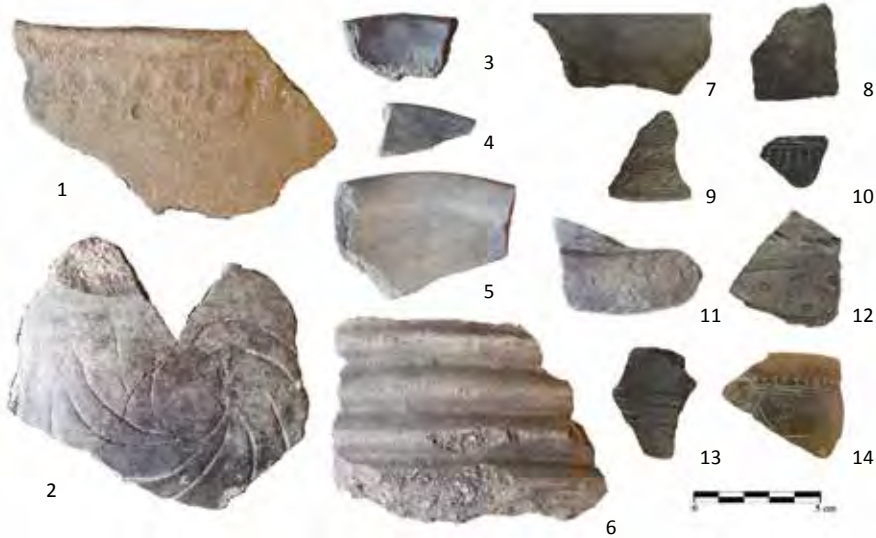
Hallazgos cerámicos elaborados a mano, de la primera (1-6) y segunda Edad del Hierro (7-14). Con decoraciones de dedos y uñas (1), solar incisa (2), estampadas (7 y 11), de peine (8-10, 12 y 14) y acanalada (13).

de los amallobrigenses —la cognatio magilancum que figura en la tessera — y al territorio de Amallobriga .