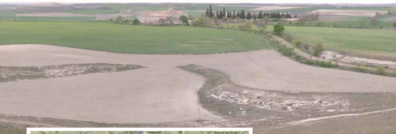
Vista del cerro de La Ermita desde lo alto de la torre del castillo de Tiedra.