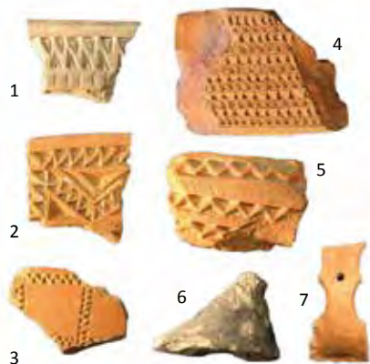
Producciones singulares excisas: cajitas (1-3), rallador (4), pie anular (5), pie (6) y mango de simpulum (7).

La individualización de las áreas en el yacimiento, ya sea por criterios de funcionalidad, cronología o adscripción cultural, no es tarea sencilla, ya que en no pocos casos pueden producirse superposiciones y enmascaramientos que ofrezcan una imagen distorsionada de lo que la recogida en superficie de materiales arqueológicos pueda sugerir. Veamos cuáles son las mismas: