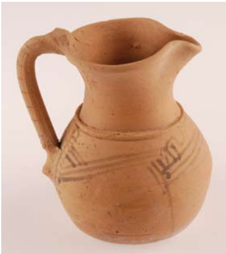
Jarra de pico con una típica decoración pintada vaccea a base de líneas entrelazadas.

tito, alejada por tanto de aquéllos, lo que nos inclina a su consideración como ofrenda. En cualquier caso este comportamiento no es nuevo en el cementerio de Las Ruedas, la tumba 9 ya proporcionó una fibula de pie alzado con botón terminal que mostraba signos de termoalteración evidentes con deformación y pérdida del muelle, estrechamente asociada a los restos cremados y panoplia militar; sin embargo sobre el depósito, en la tierra de relleno, se pudo recuperar una pieza doble, en este caso completa y con otra cañita vegetal en el muelle, que debe ser interpretada también como ofrenda.