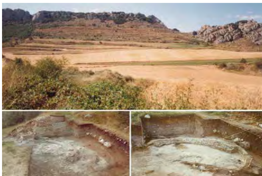
Vista del Castro de los Baraones (Valdegama, Palencia) y detalle de la superposición de viviendas circulares y muralla.

Posiblemente el mayor oppidum en la Cantabria meridional es La Ulaña, situado separando las aguas del río Odra, que van a la vertiente atlántica, y las del Tozo, que van a la vertiente mediterránea a través del Rudrón y el Ebro. Excavado por el equipo dirigido por Miguel Cisneros Cunchillos, es un gran castro de 586 ha, 285 de ellas en la plataforma superior, ocupado entre