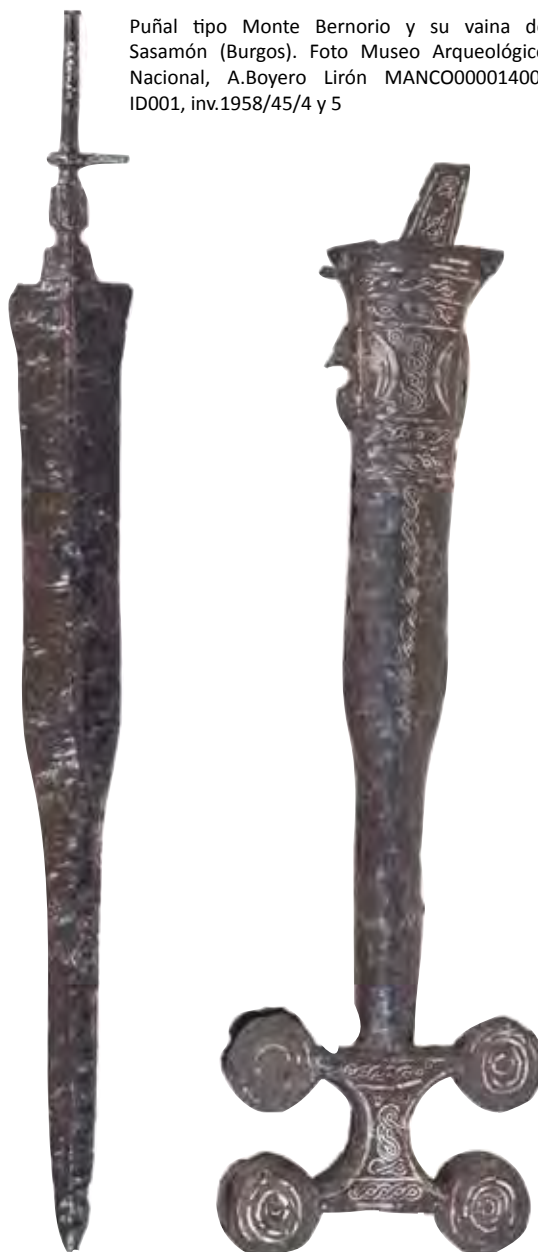
Puñal tipo Monte Bernorio y su vaina de Sasamón (Burgos). MANCO00001400-ID001, inv.1958/45/4 y 5

Hay evidencias de actividades productivas en el interior de las viviendas gracias a la presencia de telares verticales de pesas colocados cerca de la puerta y las huellas de sus pilares, molinos de vaivén y vasos-hornos con