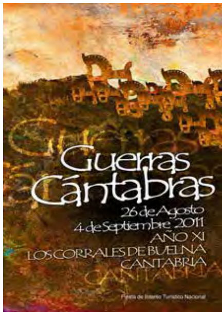
Cartel de Guerras Cántabras de 2011 en Los Corrales de Buelna, Cantabria.

dios de la Antigüedad del Cantábrico (IMBEAC), respectivamente.