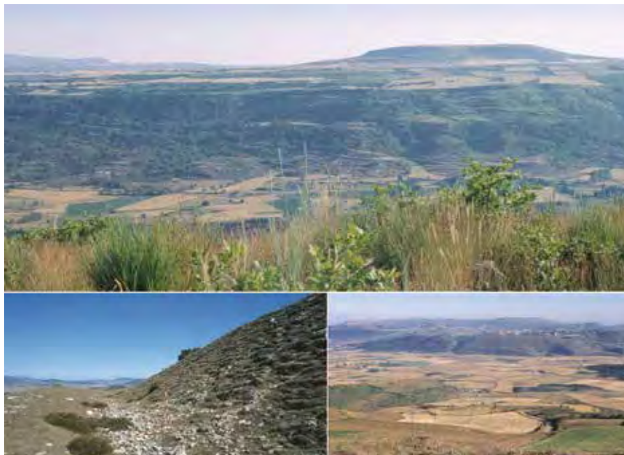
Vista del oppidum de Monte Bernorio (Villarén, Palencia) desde la parte alta de Los Baraones; foso y muralla oeste y vista desde Monte Bernorio hacia Castillejo (Pomar de Valdivia, Palencia). Fotos M. Barril (1999)

la primera Edad del Hierro y el 400 a.C. y luego en la segunda Edad del Hierro, desde principios del siglo IV a.C. al I d.C. Sus excavadores calculan una media de 500 a 600 habitantes en su momento álgido, calculando una media de 4-5 moradores por vivienda. Las prospecciones aprecian una ocupación dispersa, con agrupaciones de viviendas de planta circular o rectangular en zonas, dejando espacios sin construcciones entre ellas que separan y sirven de comunicación entre los "barrios". Cabe destacar dos posibles edificios públicos cerca de las puertas. Las líneas defensivas de muralla se adaptan a la orografía del terreno y son más potentes en el lado norte, el