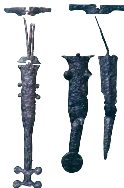
Puñales de la necrópolis y cabaña de Monte Bernorio, excavaciones de San Valero.