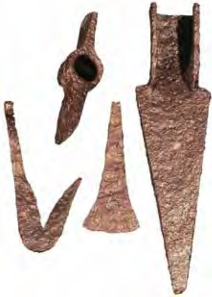
Útiles hallados en la cabaña que San Valero excavó bajo la muralla E del recinto interior de Monte Bernorio.

nosa. El conjunto del castro tiene forma triangular con tres líneas defensivas y entre las dos últimas murallas estructuras de habitación de planta rectangular y circular, de incierta datación, y entre ellas una estructura de piedra con planta rectangular, semihípocea, construida con boques ciclópeos y un falsa cúpula creada por aproximación de hiladas, que por su singularidad se le supone un uso social o cultural de cronología incierta. Los materiales prerromanos datan la ocupación indígena en torno al siglo II a.C.