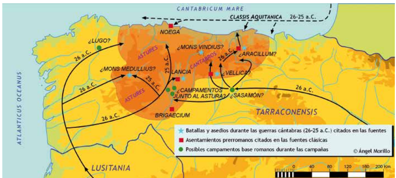
Mapa de las guerras cántabras según A. Morillo (2009).

El conjunto de los materiales documentados parecen confirmar algunas descripciones de carácter etnológico de los escritores antiguos como Estrabón (III, 4, 17-18) que hacen referencia a que comían bellotas, o bebían caelia (cerveza), pero otras como el trabajo de la agricultura por las mujeres, la práctica de la covada o la entrega de dote por los esposos a las mujeres no es posible comprobarla, aunque sí puede suponerse que si los varones estaban guerrearando o trasladando los ganados las mujeres cultivarían las huertas y terrenos del entorno, como ha sucedido en las poblaciones pastoriles de la montaña hasta la época preindustrial.