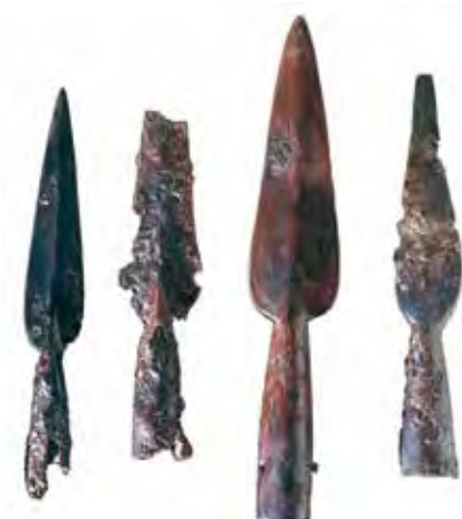
Puntas de lanza de la necrópolis de Monte Bernorio.

más vulnerable. Otra muralla cruzaba el castro transversalmente y una serie de muros delimitan zonas, algunas de las cuales protegerían los manantiales. Muy cerca está el castro de Amaya, en el que la presencia prerromana es muy poco significativa.