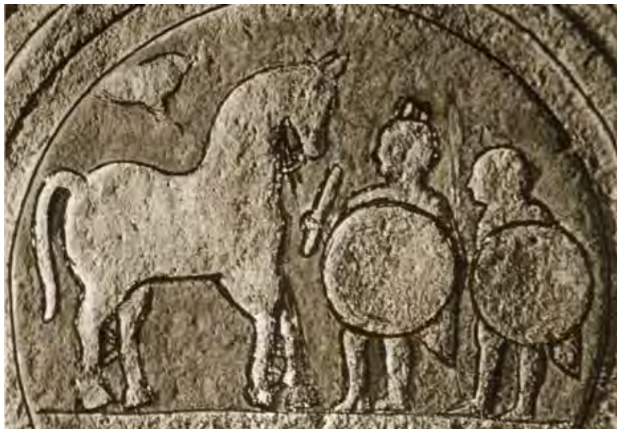
Dibujos de la parte superior e inferior de la estela de Zurita (Cantabria) según A. Ocejo (2012).