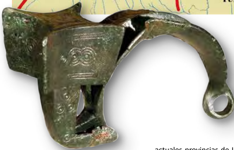
Cantabria en el siglo I, a partir de los datos de Estrabón, Mela Tolomeo y algunos epígrafes, según A. Oejo (2009) modificado. Fibula de torrecilla, Monte Bernorio.

A ctualmente el nombre de Cantabria alude a un ente político-administrativo, a una Comunidad Autónoma que tomó su nombre del pueblo prerromano que lo habitó. Los límites del pueblo histórico, sin embargo, exceden de los de la comunidad administrativa ya que ocupó parte de Asturias y del norte de las