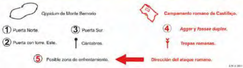
Vista de los emplazamiento del oppidum de Monte Bernorio y del campamento romano ( castrum aestivum ) de Castillojo, con la propuesta de la zona probable de batalla campal y del ataque al oppidum (imagen de Google Earth modificada por A. Martínez y J.F. Torres-Martínez. IMBEAC, en Torres-Martínez, Serna Gancedo y Domínguez-Solera, 2011).

En todos los yacimientos cántabros asediados se construyó luego un barracón o un castillete donde se instalaría una guarnición romana y se hallan abundantes restos militares romanos y en alguno como Monte Bernorio, se documenta lo que piensan sus excavadores eran los barracones donde se alojaban las mujeres que seguían a los legionarios. La mayoría de los campamentos de este momento eran castra aestiva , es decir campamentos temporales consistentes en una muralla defensiva con foso y en