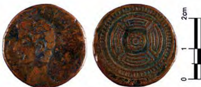
Denario (plata) de Publio Carisio conmemorando las Guerras Cántabras de Augusta Emerita (Mérida, Badajoz). Hacia 25-23 a.C. Fotos Museo Arqueológico Nacional, M. Á. Camón 1993_67_12170-ID003 y 1993_67_13193-ID003