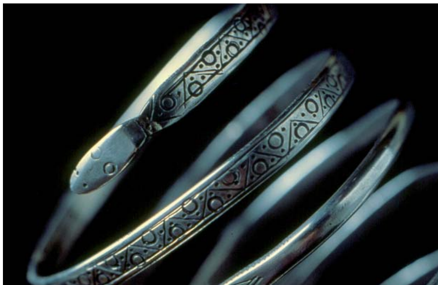
Detalle de una de los brazaletes espiraliformes.

tejida de Palencia 3, con sólo réplicas en los tesoros de Roa y Padilla 1, además, según todos los indicios, de en la necrópolis vacceo-romana de Eras del Bosque, en la propia capital palentina (Taracena 1947: 104). Y la relación se completa con una llamada de atención sobre dos tipos no menos originales de fíbulas: las de doble pie simétrico y las anulares con pie y arco amovibles. Entre las primeras, normalmente de plata y con los pies vueltos rematados en botones, cabe destacar un ejemplar fundido en oro de Palencia 3, hoy en el MAN (Almagro, 1960a), cuyos remates repiten los abultamientos piriformes que veíamos en los más gruesos torques funiculares. Bastaría este detalle para concluir su condición de joya meseteña, pero es que además su esquema —pese a cierta convergencia con fíbulas centroeuropeas latenienses— sólo tuvo aceptación en el centro de la Península Ibérica (Delibes et al. 1993: 433-434). Algo similar a lo que sucede con las pesadas fíbulas anulares, barrocammente decoradas con granulado, con filigrana y con botoncitos, como la depositada en la Hispanic Society que se sospecha formaba parte del tesoro 1 de Palencia, cuyos únicos paralelos en metales nobles se sitúan en Arrabalde 1 y en San Martín de Torres (Delibes, 2002).