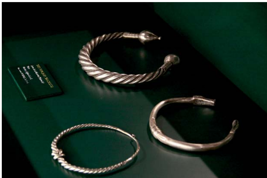
Torques del tesoro 2 durante su exposición temporal en el Museo de Palencia.