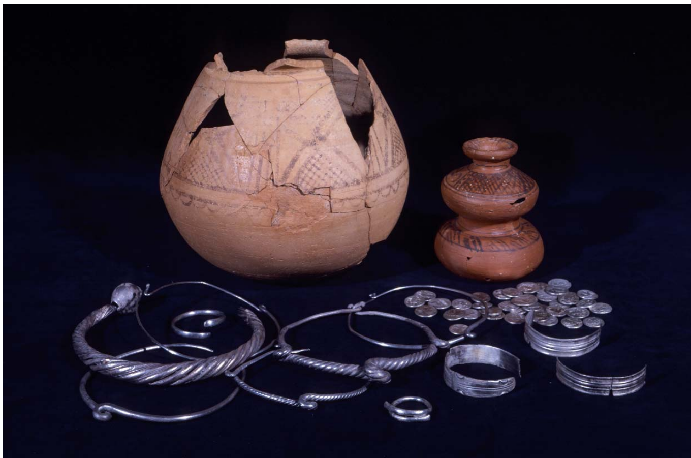
Joyas de Palencia 3 procedentes de la colección de las religiosas Filipenses (Fotografía: Museo de Palencia).

una lámina de Villegas en la que aparece perfectamente señalado el lugar del hallazgo, el colegio de las Filipenses en la calle Santo Domingo de Guzmán. El depósito yacía a tres metros de profundidad, bajo un importante nivel de cenizas, que ahora podemos calificar como romano. Las joyas aparecieron en el interior de una olla cerámica de mediano tamaño, mientras que las monedas, descubiertas al día siguiente, se encontraban dentro de una pequeña vasija cerámica con una original forma de botella biglobular; ambos recipientes habían sido realizados a torno y mostraban decoración geométrica pintada.