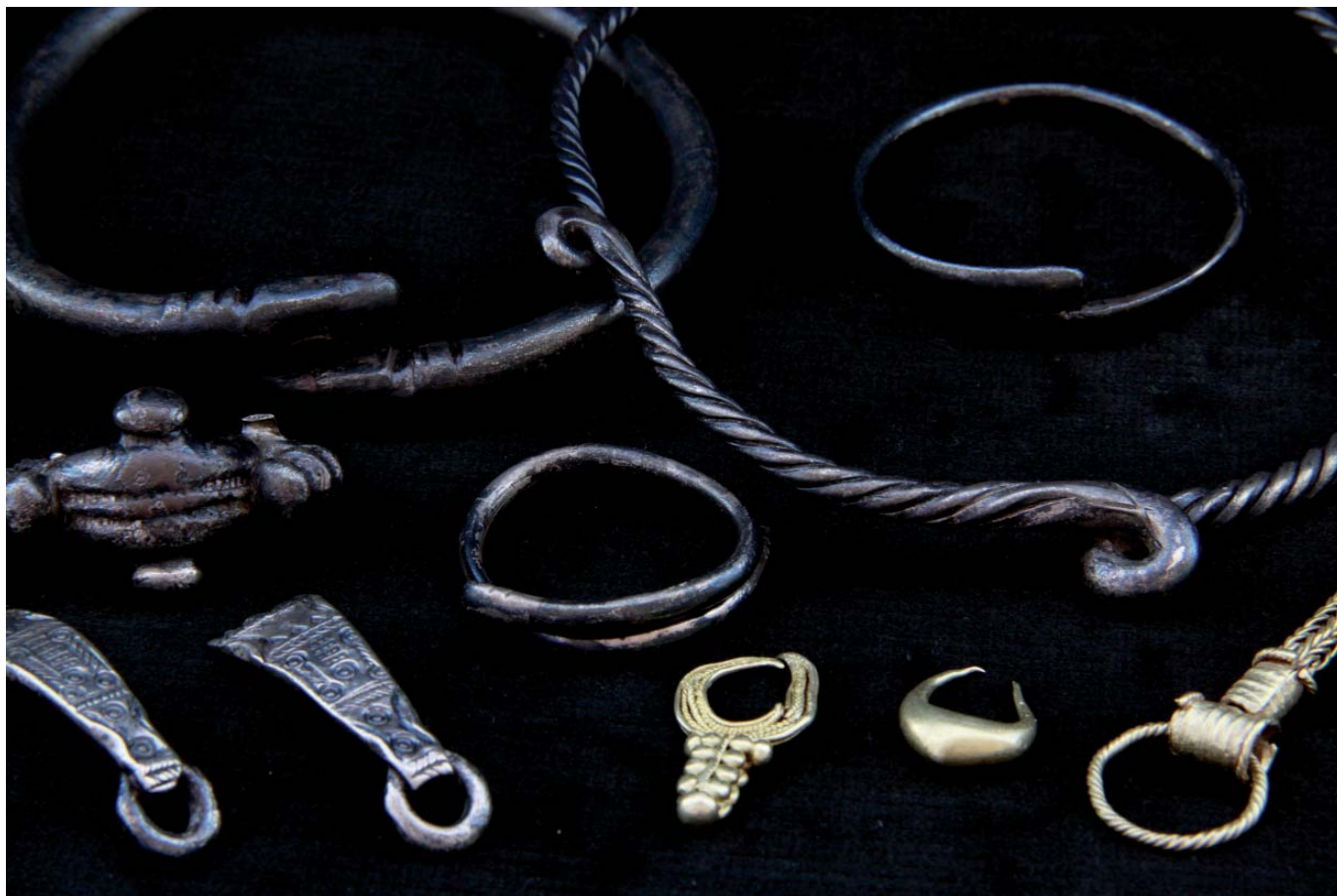
Conjunto de joyas de Palencia 3 procedentes de la colección L. Carlón (Fotografía: Museo de Palencia).

al río Carrión, a dos kilómetros y medio del yacimiento prerromano más próximo, que es nada menos que El Pico del Tesoro). Por otro lado, y con respecto a esta ocultación, podríamos incluso plantearnos un carácter votivo, la posibilidad de una ofrenda a las ninfas de las aguas del Carrión.