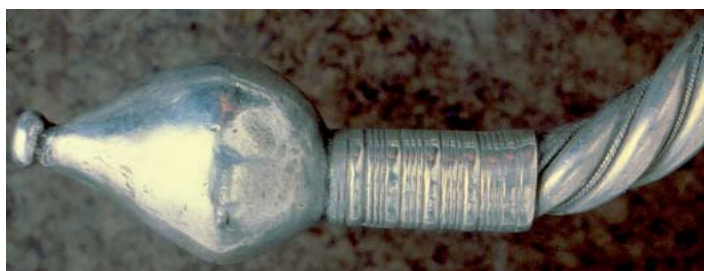
Detalles de uno de los torques funiculares.

Las joyas de los tesoros palentinos sobrepasan en número ligeramente las seis decenas y, con raras excepciones, son los mismos adornos de tipo personal presentes en cualquier atesoramiento prerromano peninsular, esto es torques, brazaletes, pulseras, anillos, pendientes y fíbulas. Sin embargo, se trata de versiones singulares, con detalles formales y decorativos de suficiente personalidad como para deducir la existencia de una joyería específica, propia de un “grupo de la Meseta Norte” en palabras de Raddatz (1969: 20). Una joyería que, en virtud del recurso mayoritario a la plata en vez de al