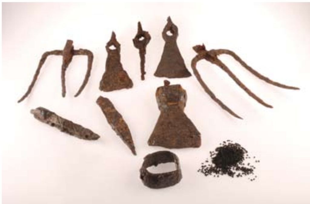
Útiles de labranza recuperados en una bodega de Las Quintanas.

dado que, como puede apreciarse, remite, excepción hecha de la siega, habida cuenta de que faltan las hoces, a las diferentes faenas agrícolas.