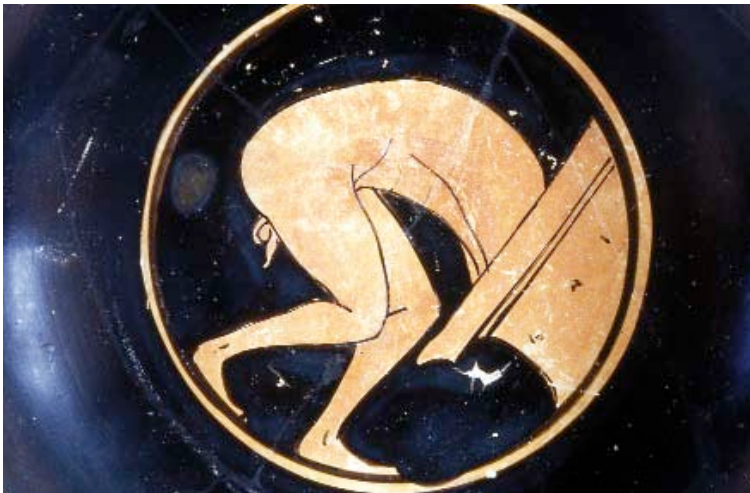
Joven desnudo introduciéndose en una gran tinaja de vino. Medallón de una copa de figuras rojas del Pintor de Evérgides. Finales del siglo VI a.C. Museo Arqueológico Nacional, Madrid.

“¡Ea, niño, acércanos la crátera, para que pueda ofrecer la bebida y beber sin tomar respiro. Vierte diez medidas de agua y cinco de vino, de modo que logre sentirme un seguidor báquico, pero sin excederme”.