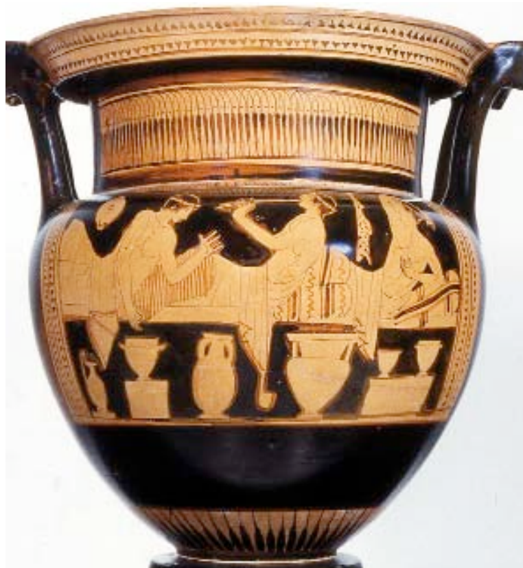
Escena de banquete con tres simposiastas jóvenes. El del centro toca el aulós. Cratera de columnas de figuras rojas. En torno al 460 a.C. Museo Arqueológico Nacional, Madrid.

¿Por qué correr y precipitarse como hace, lleno de ansia, el joven o niño desnudo de esta copa de figuras rojas que se arroja a la gran ti-