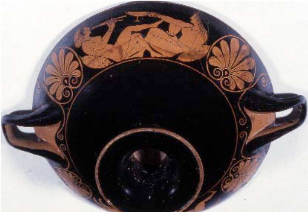
Dos heteras desnudas. Una toca el aulós, la otra le ofrece una copa y le invita a beber con estas palabras: “¡Bebe tú también!”. Pintor Oltos. Hacia 520 a.C. Museo Arqueológico Nacional, Madrid.