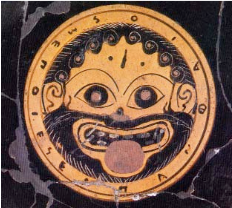
Máscara frontal de Gorgona. Medallón de una copa de figuras negras. Inscripción con la firma del alfarero Pamfeo: “Pamphaios m’epoiesen”, “Pamphaios (Panfeo) me hizo”. Hacia 520 a.C. Museo Arqueológico Nacional, Madrid.

y él quiere también alcanzar y poseer un día su propio cuerno de bebida. Ambos elevan brazos y piernas en un gesto que parece propiciar mágicamente la exuberante vegetación que les rodea. Es la bebida agreste, no del todo la ciudadana: el vino lo contiene un vaso arrancado a la naturaleza –un cuerno animal- que al no poseer asas no puede intercambiarse ni compartirse fácilmente. Es un vaso egocéntrico, egoísta. No pertenece aún al simposio recostado, compartido, el más regulado de las palabras y las anchas copas con dos asas. ¿Hay algo de certamen en esta escena? No lo sé de cierto pero sí puede haber una enseñanza, un modelo, una relación entre el adulto y el adolescente que se inicia. Pero, sobre todo, hay una relación íntima entre el vino, la danza viva y la eclosión vertical y mágica de la naturaleza.