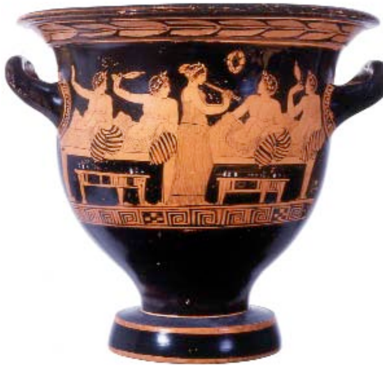
Una flautista toca el aulós ante cuatro simposiastas recostados. Tercer cuarto del siglo V a.C. Museo Arqueológico Nacional, Madrid.

El espacio del simposio griego es, principalmente, de varones. Hemos hablado del presidente de sala, que invocará la protección de los dioses antes de comenzar la bebida y también en la despedida cortés, al concluir. Criados y niños atienden órdenes y trajinan con cráteras y con ánforas, con cazos que mezclan, miden y sirven el vino, traen y llevan vasos refrigeradores, llamados psykteres , que flotarán en el agua he-