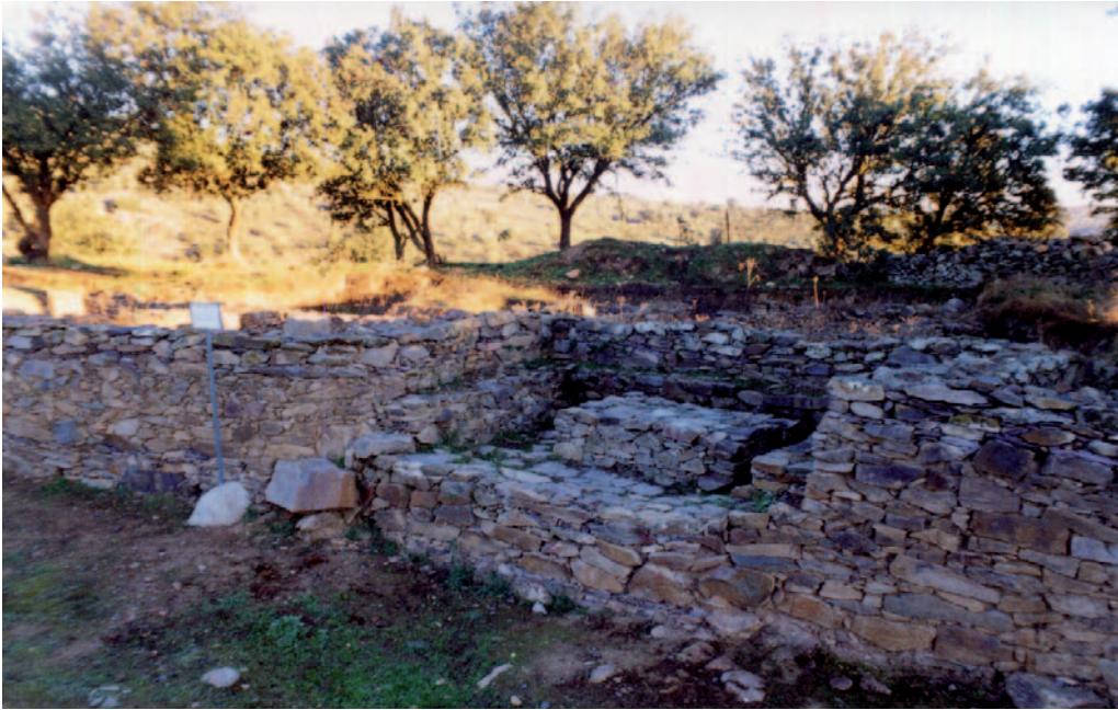
Santuario del Castrejón de Capote (Higuera la Real, Badajoz), siglos IV-II a.C.

por realizar, dada la calidad y las posibilidades que ofrece esta línea de investigación, y es de esperar que trabajos como éste ayuden a la apertura de nuevos proyectos y a la consolidación de los ya existentes.