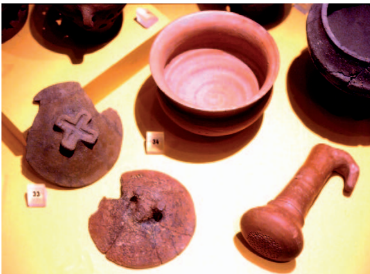
Santuario de Garvão (Aljustrel, Baixo Alentejo, Portugal). Siglo III a.C. Aspergyllus , tapaderas y vasijas de la favissa del castro. Museu Nacional de Arqueologia “Leite do Vasconcelos” de Lisboa.

Afirma Fabião: “Finalmente, a riqueza geral de todo o conjunto, não deixa de colocar algumas interrogações quanto à natureza das áreas escavadas, infelizmente impossíveis de esclarecer cabalmente. Penso que não será descabido supor que no decurso da escavação possa ter sido atingido um local de características análogas à do chamado ‘altar’