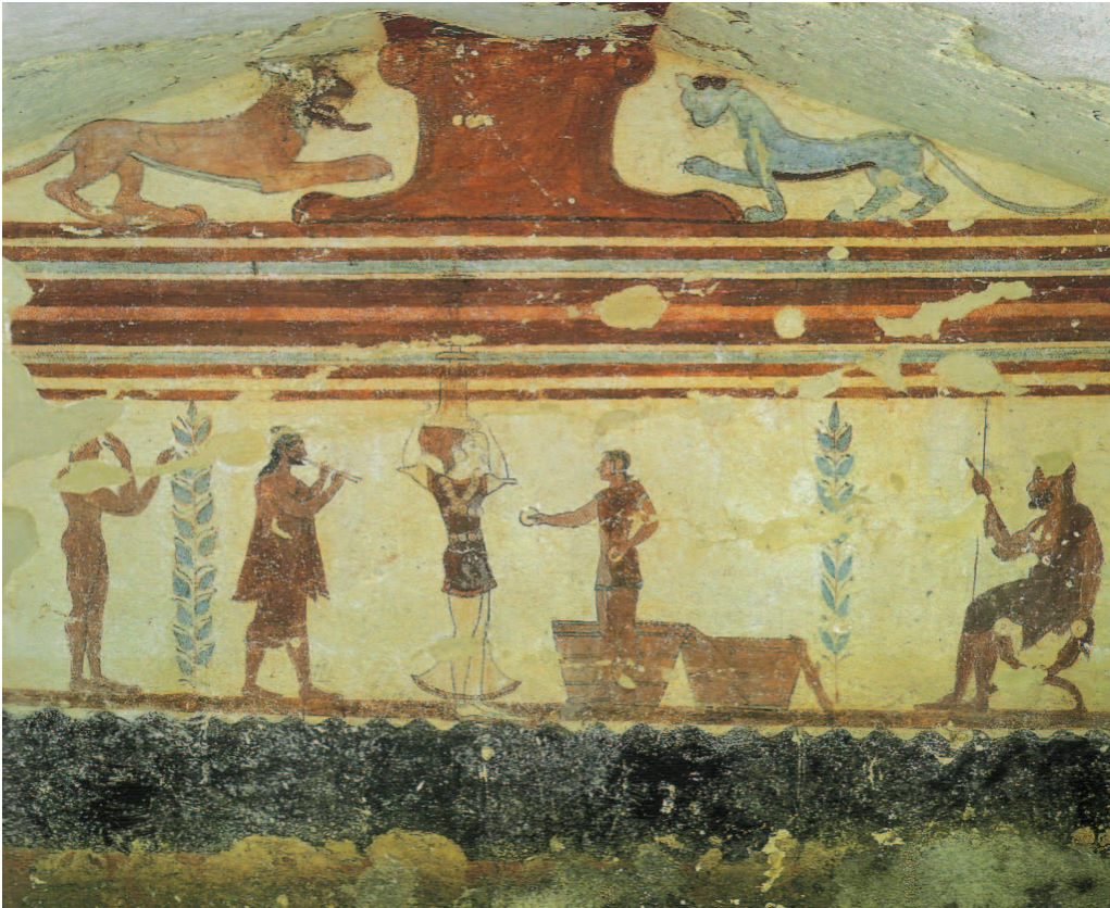
Tarquiniya, Tomba dei Giocolieri , pared del fondo, 530 a.C.

bas principescas (Regolini Galassi). Así, en el osario de Montescudaio (datado en el segundo cuarto del siglo VII a. C.) las imágenes representan un banquete solitario (el hombre aparece sentado sobre un trono mientras la mujer, de pie, le sirve vino), sin la presencia de otros comensales. La ideología funeraria no proporciona, por tanto, signos de la práctica del banquete como expresión social.