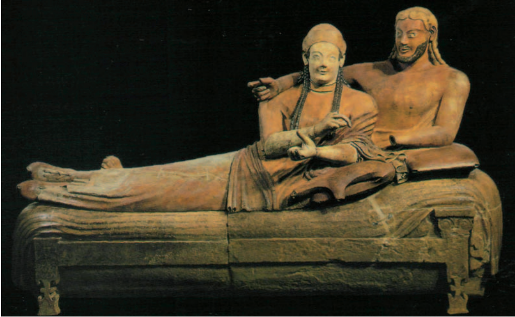
Sarcophago degli Sposi , Cerveteri, 525-500 a.C. París, Museo del Louvre.

bres locales ( thafna y zavena ), indicando una "manera nacional" de beber mientras el contenedor y el jarro con el que se coge vino - thina (gr. deinos ), qutum o pruXum - revelan préstamos del griego lo que probaría su pertenencia al simposio griego, adoptado por etruscos hacia el 650 a.C.