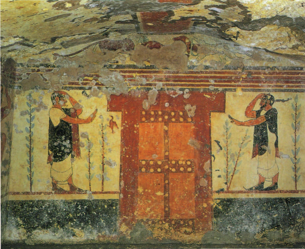
Tarquiniya, Tomba degli Auguri , pared del fondo, 530 a.C.

El consumo del vino estaba reservado a las capas sociales más elevadas quedando, desde su introducción, unido a la práctica del symposion una ocasión para mostrarse pródigo con los propios bienes y humillar al mismo tiempo a los rivales mediante la lapidación instantánea de riquezas. El testimonio de la cerámica es concluyente: la práctica totalidad de los vasos de importación así como la producción local de alta calidad van destinados al banquete y al ritual