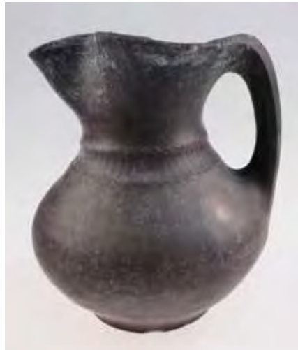
Jarra de pico en cerámica ‘negra bruñida’ de la tumba 263b. Necrópolis de Las Ruedas.

Otro aspecto destacable es el nutrido conjunto de estelas funerarias recuperadas en la zona intervenida —una veintena de ellas— y que mantendrían relación con las tumbas documentadas, aunque en la actualidad no sea fácil establecer las correspondencias concretas como consecuencia del laboreo agrícola que las ha desplazado parcialmente o fragmentado. Son piedras calizas de gran formato que, apenas se levanta el nivel de arada superficial, emergen abatidas en posición plana o ligeramente oblicua y que en numerosos casos muestran la cara de contacto con el suelo con señales de rubefacción por efecto del fuego, dando la sensación de que fueron echadas abajo intencionadamente en un episodio de violencia que podría relacionarse tal vez con la contienda romana (véase VACCEA ANUARIO 2010). Llama la atención que el más oriental de los sectores trabajados, pese a haber rendido un número importante de tales estelas, no haya proporcionado, sin embargo, ninguna tumba.