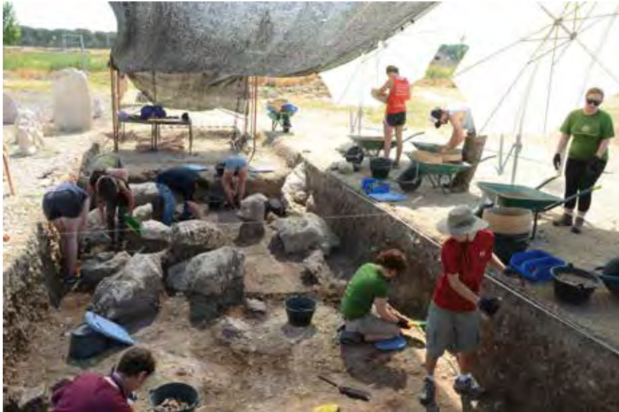
Documentación de las estelas calizas en el sector F1j9 de Las Ruedas, durante el proceso de excavación.

cerámicas y un fragmento de broche de cinturón bronceo) y el segundo con catorce (todos cerámicos pero de gran singularidad, como las ‘negras bruñidas’, un simpulum y un carrete de hilo, entre otros), caben lecturas de rango y de filiación que será necesario explicar en un futuro conforme se vayan incrementando este tipo de evidencias.