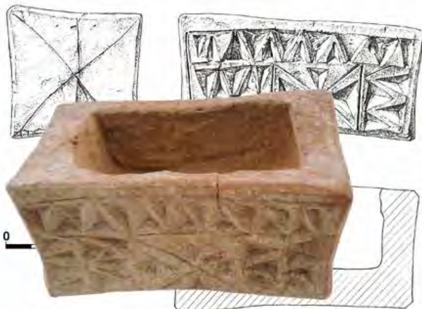
Cajita excisa, ápoda y sin asa, de la tumba 269. Necrópolis de Las Ruedas.

bría pensar que funcionarían como ‘cazoz’; su vínculo con los cyathus o cazos para el vino es innegable, por más que bajo aquella terminología se exprese un contenido no estrictamente funcional y sí más simbólico o litúrgico. En el ejemplar de la tumba 263b pintiana, a la decoración pintada de ovas y series de triángulos alargados que decora su cáliz, se añade una elegante decoración de zig-zag exciso en el mango propiamente dicho, lo que refuerza la idea de recipiente ‘singular’.