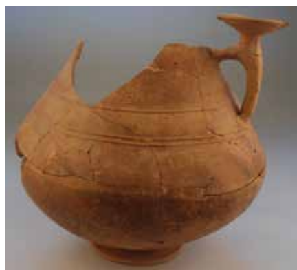
Kernos incompleto de la tumba 269. Necrópolis de Las Ruedas.