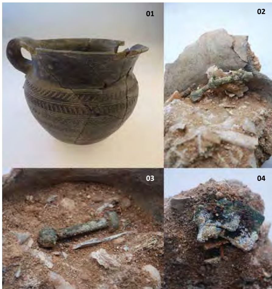
Urna cineraria de la tumba 261 de Las Ruedas (1). La microexcavación de su contenido permitió comprobar, junto a los restos óseos humanos cremados, la presencia de pasadores (2 y 3) y fragmento de un broche de cinturón (4), ambos en bronce, que acompañaron al difunto en la pira funeraria.

Dentro de dicho marco espacial de intervención, se exhumaron un total de catorce tumbas (261 a 272bis, siendo la 263 doble) dispuestas en hoyos abiertos en el nivel de terraza estéril de arenas y gravas. De ellas, seis pueden considerarse muy alteradas —264, 266, 267, 268, 270 y 271—, con pérdidas sustanciales de material e información; su mala conservación en algunos casos puede ser de época, en otros cabe achacarla a la acción del arado moderno; así en la tumba 264 pudo comprobarse la dirección de arrastre de los materiales en la destrucción parcial del depósito. Otras siete sepulturas se preservaron de forma integral —únicamente la 269 parece mostrar una ligera alteración en su parte más superficial— debido a que se encontraban selladas por un nutrido conjunto de lajas calizas dispuestas horizontalmente —tumbas 261, 262 y 265— o bien por la notable profundidad de sus hoyos pese a carecer de aquella protección —tumbas 263 y 272—. Una octava más, la 272bis, cabe pensar que se conservara también intacta, pese a carecer de todo tipo de ajuar u ofrenda de acompañamiento y comparecer el paquete óseo directamente apoyado sobre el suelo de gravas, sin interesarle