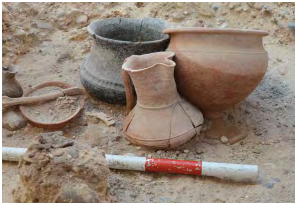
Tumba 272 de Las Ruedas. Detrás de la jarra de pico y del crateriforme puede observarse el gran vaso ‘negro bruñido’ ricamente decorado.

Si profundizamos en el análisis de los conjuntos mejor conservados, puede plantearse la riqueza general de los mismos, con trece, diecisiete, diecinueve, veintitrés, treinta y trece objetos para las números 261, 262, 263, 265, 269 y 272, respectivamente. Todos estos conjuntos resultan coherentes con un contexto tardío del mundo vacceo, entre el siglo II a.C. avanzado e inicios del I a.C., tal y como vienen a demostrar, por ejemplo, las abundantes ‘cerámicas negras bruñidas’, un tipo de producción perfectamente caracterizado a través del registro pintiano (véase VACCEA ANUARIO 2009) y que después de esta campaña adquiere mayor relieve si cabe — presente en las tumbas 262, 263b, 264, 265, 269, 270 y 272—, constatándose formas ya conocidas como los vasos y botellas, pero también otras nuevas como la jarra de pico completa de la tumba 263b, que muestra sobre el cuello la característica decoración de resaltes y finos bruñidos de punta roma apenas perceptibles; de excepcional cabe tildar el vaso acampanado con resaltes y decoración compleja (acanaladuras y abollonaduras, más incisiones en forma de espiga) de la tumba 272, cuya exhumación resultó muy complicada habida cuenta la profundidad a la que se hallaba (más de dos metros), la humedad existente y la mala cocción de la pieza, lo que determinó un largo y tortuoso