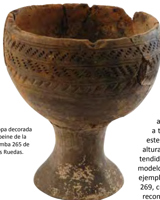
Copa decorada a peine de la tumba 265 de Las Ruedas.

Creaciones, de las que recientemente hemos realizado un estudio en profundidad, que representan un momento de plenitud de la alfarería