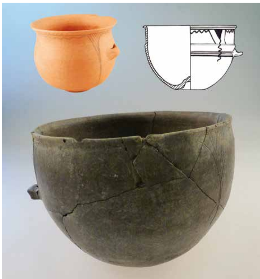
Comparativa entre vasos pintados anaranjados de las tumbas 184 y 95 y el 'negro bruñido' de la 269. Obsérvese cómo comparten el motivo decorativo, aunque no la técnica. Necrópolis de Las Ruedas.

proceso de consolidación in situ hasta poder ser extraído; su rareza viene dada por su gran formato, que con 25,5 cm de diámetro máximo en la zona de la carena y 20 cm de altura, se convierte en el recipiente de mayor capacidad de este tipo constatado hasta el presente.