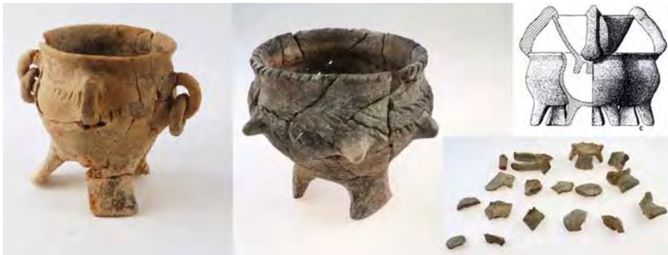
Vasos trípodas de las tumbas 265 y 269. El dibujo, correspondiente al trípede compuesto de la tumba 45, sirve para ilustrar la reconstrucción del descubierto en la tumba 269. Necrópolis de Las Ruedas.