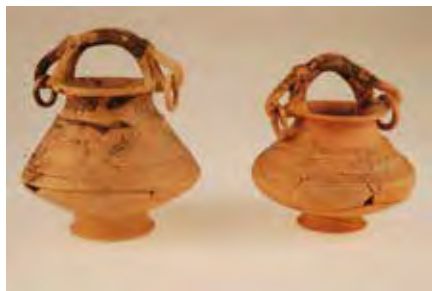
Jarritas de la tumba 269. Necrópolis de Las Ruedas.