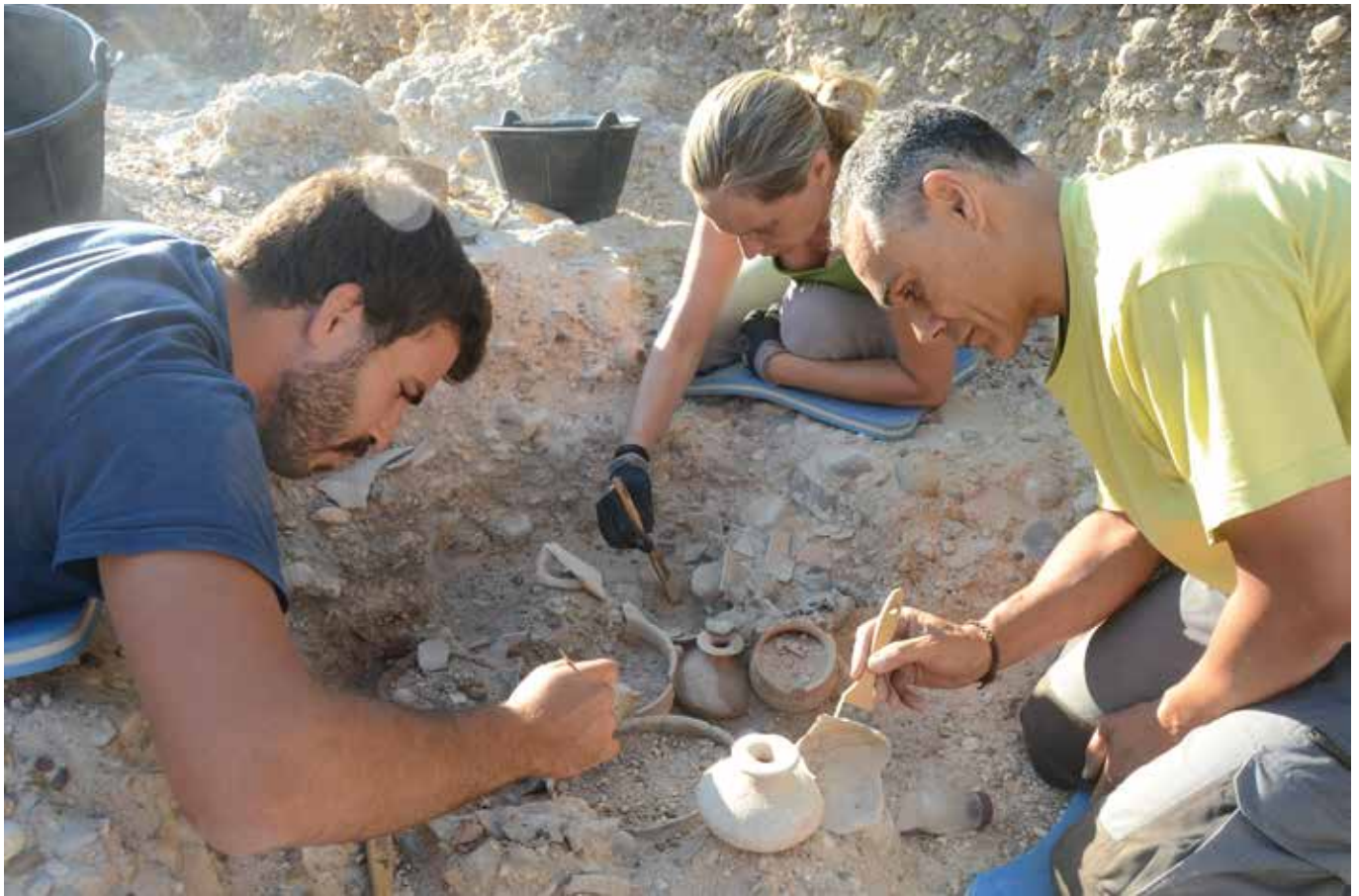
Excavación de la tumba 269. Necrópolis de Las Ruedas.

que se encontraban en buen estado de conservación permiten obtener nuevos datos indiscutiblemente provechosos. En total se recogieron 166 objetos en sepulturas, independientemente de los aspectos de conservación, de los cuales 37 son elementos metálicos de bronce