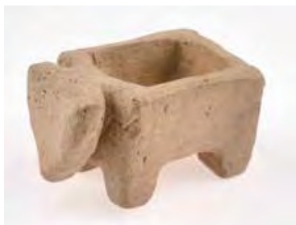
Cajita zoomorfa miniaturizada de la tumba 261. Necrópolis de Las Ruedas.

conservados, como el de la tumba 45 de la necrópolis de Las Ruedas. Nuevamente son objetos que remiten, una vez más, al contexto señalado para la necrópolis de Colenda.