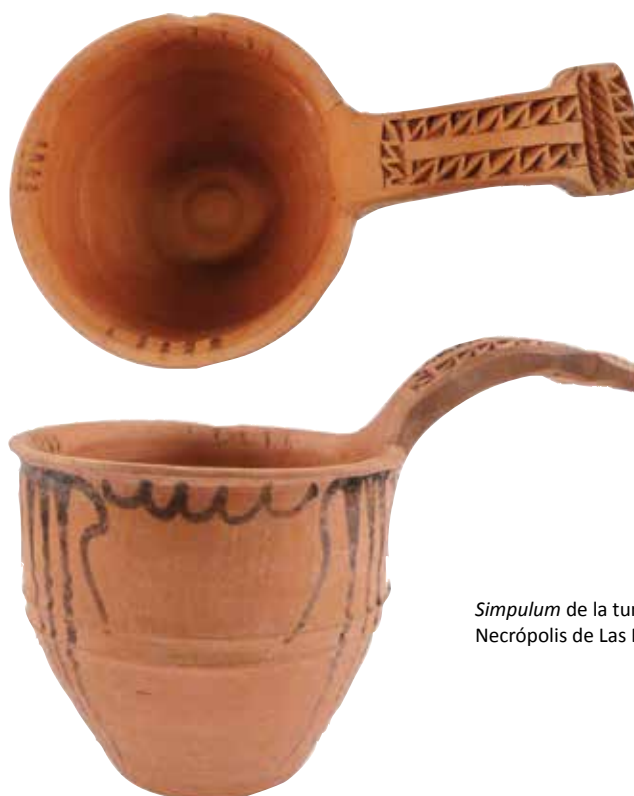
Simpulum de la tumba 263b. Necrópolis de Las Ruedas.

Haciendo una observación general sobre la campaña de 2013, aunque un número considerable de tumbas estuviera bastante perturbada, las