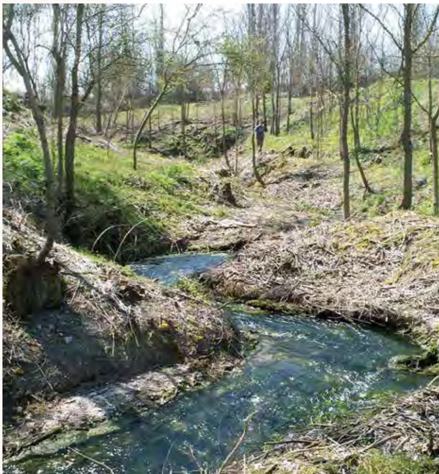
El arroyo de La Vega a escasos metros de su desembocadura en el Duero, con sus característicos meandros.