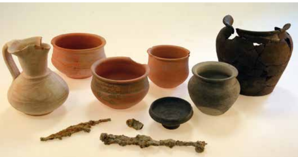
Objetos de la tumba 259.

Carlos Sanz Mínguez Juan Manuel Carrascal Arranz