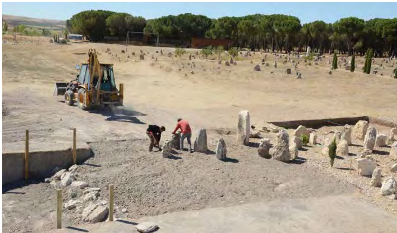
Restauración del paisaje funerario de Las Ruedas, con la estelas enhiestas en su lugar de origen, la escollera reconstruida y el paleocauce marcado con carrizos.