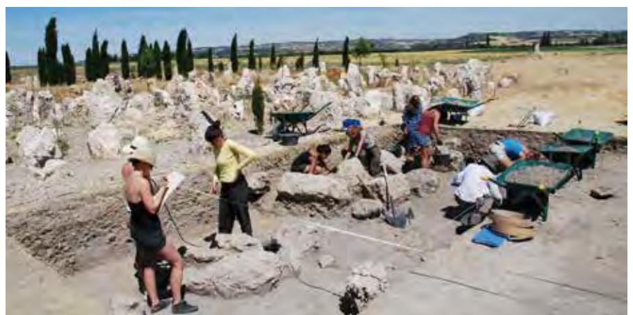
Inicios de los trabajos de excavación durante la campaña de 2012, en el límite extremo de la terraza de gravas y arenas, y estelas caídas detectadas.

Aunque hablamos de ocho tumbas, en realidad han sido once los enterramientos detectados, ya que la número 256 resultó ser doble y la 255 triple (dos y tres urnas cinerarias, res-