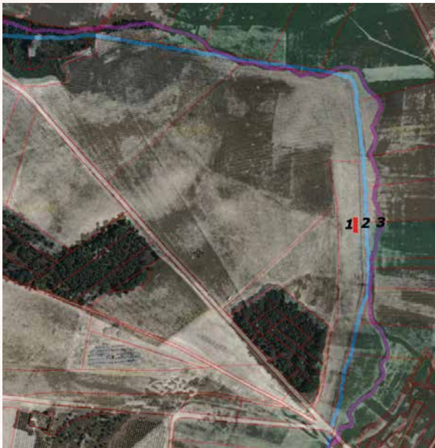
Trazados del siglo I a.C. (1), 1984 (2) y 1956 (3) del arroyo de La Vega a su paso por la necrópolis de Las Ruedas.

Esta circunstancia nos permite comprobar cómo el arroyo de La Vega ha ido modificando el trazado de su cauce a lo largo del tiempo. Sabemos que el actual es fruto de su canalización rectilínea para adaptarse a la Concentración Parcelaria realizada en Padilla de Duero en 1984. El ahora descubierto en las excavaciones es el existente hace dos mil años. Este paleocauce se sitúa a veinte metros del actual trazado, pero si observamos la silueta del arroyo en la fotografía del vuelo americano de 1956, esto es, antes de su conversión en canal, y superponemos el contemporáneo, a través de una imagen de SIGPAC, comprobamos que la distancia en este punto preciso era aún mayor, ya que el arroyo discurría otros veinte metros más hacia el este antes de la Concentración. Es decir, en los últi-