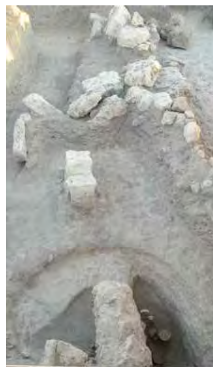
Perspectiva de la tumba 259 en relación a la escollera que afectó.

de las aguas ante posibles inundaciones; aunque para conseguirlo se vieron obligados a acuñar su base irregular mediante trozos de caliza y algún canto rodado, lo que provocó a su vez una preocupante inclinación en dirección contraria, es decir, hacia el cauce, que fue contrarrestada con la acumulación