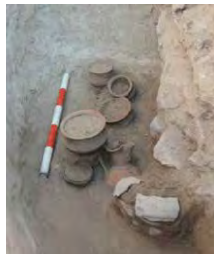
Detalle de los ajuares y ofrendas de la tumba 259.

La jarra, de pasta blanquecina y decorada con motivos animalísticos, se adscribe sin ningún género de dudas a la influencia de las producciones de tipo Clunia, que se convirtieron en punto de referencia de la cerámica pintada de época romana y tradición indígena en la Meseta Norte. La producción de las nuevas variedades en los talleres de dicha ciudad comenzó a principios de la segunda mitad del siglo I d.C., para hacer frente a la entrada masiva de los