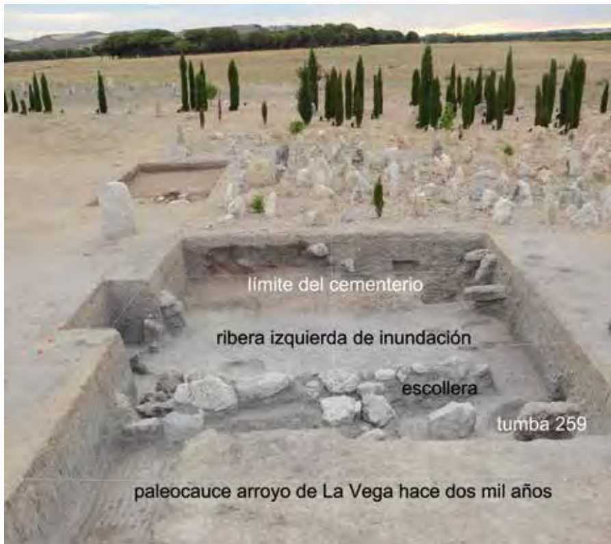
Esquema de las diferentes áreas definidas entre el paleocauce de La Vega y el cementerio de Las Ruedas.

mos dos mil años el arroyo de La Vega vio modificada su trayectoria en este punto concreto en más de cuarenta metros.