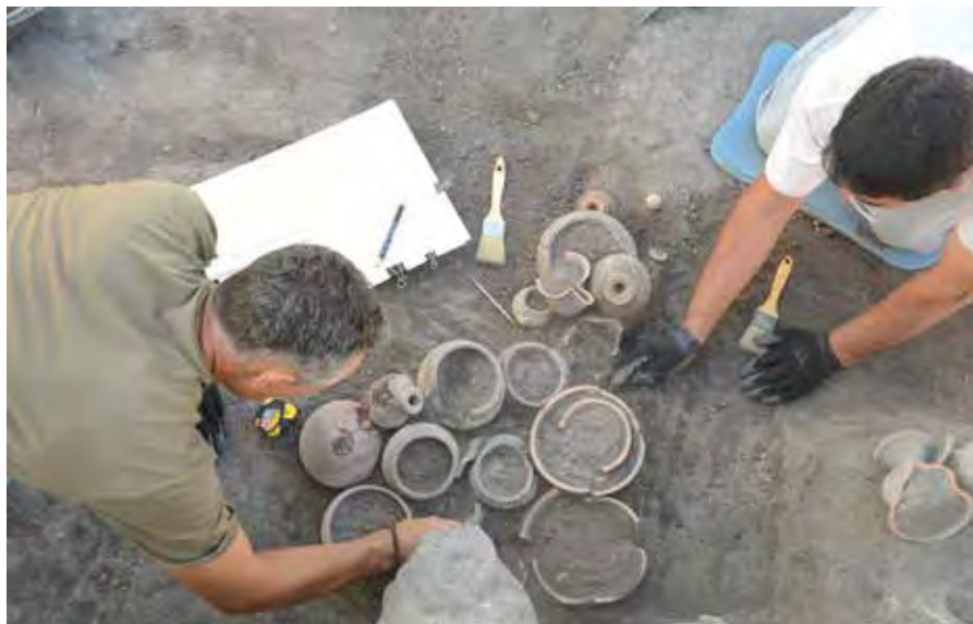
Proceso de excavación de la tumba 260.

pectivamente), tipología de enterramiento este último hasta ahora inédito en su configuración característica con la particular distribución de medio centenar de objetos formando una especie de frontón, es decir, con dos conjuntos más profundos y algo separados entre sí (255a y 255b) y uno superior dispuesto entre ambos a mayor altura (255c), coronando el vértice de la estructura funeraria.