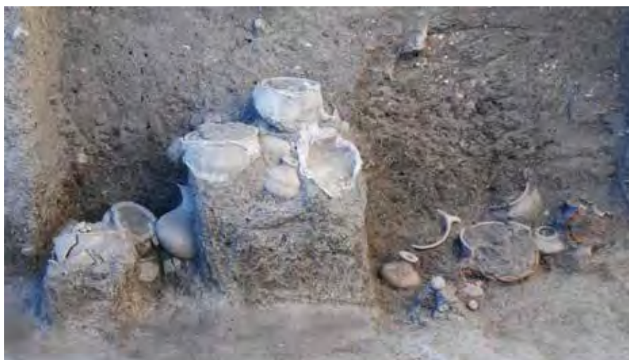
Tumba triple 255.

La labor del arqueólogo no concluye con la recuperación de nuevos datos y el traslado de materiales a los “cuarteles de invierno” para su proce-