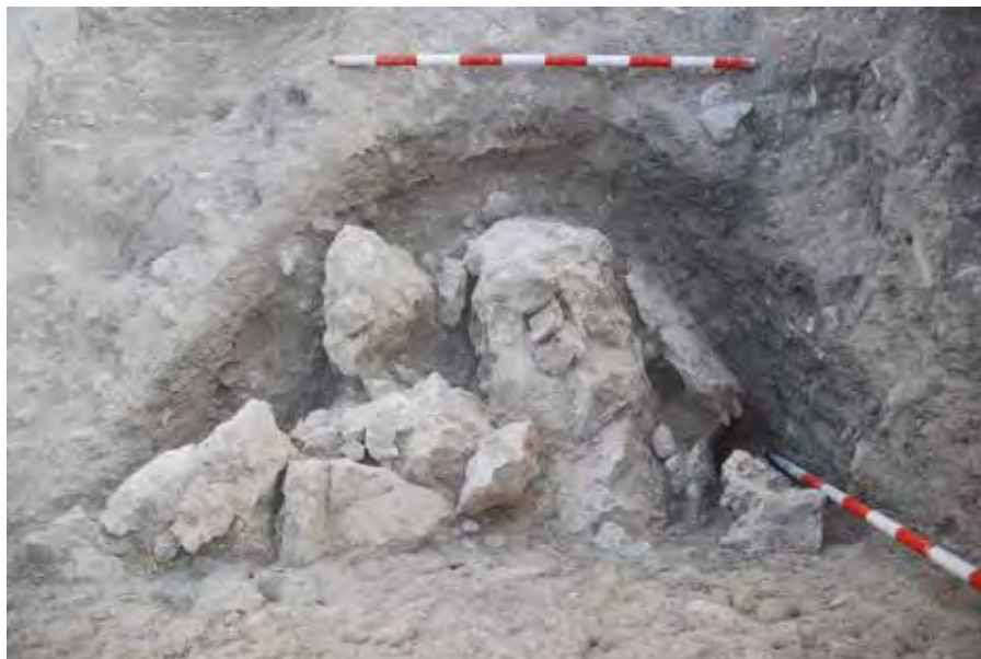
Hoyo de la tumba 259 que rompió la escollera.

desordenada de varios bloques calizos de tamaño considerable.