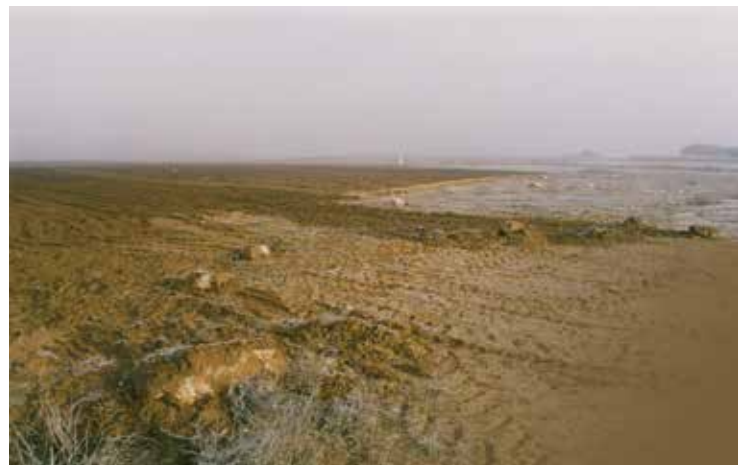
Aradas destructivas en la necrópolis de Las Ruedas, con exhumación de estelas funerarias (Sanz, 2009).

Conviene recordar que en esta zona, hasta la realización de la concentración parcelaria en 1984, no habían entrado los tractores, dedicándose el terreno tradicionalmente a viñedo, que era arado con mulas. En 1985 el laboreo con tracción mecánica sacó a la superficie centenar y medio de estelas funerarias que yacían caídas bajo el nivel vegetal, situación que se mantendrá, año tras año, hasta el último episodio denunciado en 2008, contabilizando más de medio millar de estelas arrancadas, que regularmente se des-