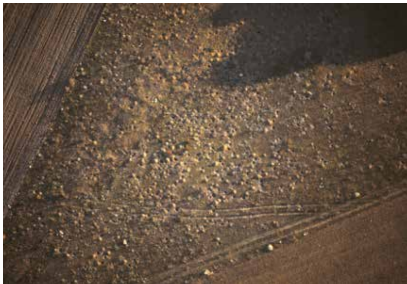
Fotografía aérea del millar de hoyos furtivos realizado en 1990 en la necrópolis de Las Ruedas (Sanz y Escudero, 1991).

En segundo lugar debemos hablar de las acciones de saqueo. La realización de hoyos furtivos resultaba frecuente en este espacio, sobre todo en otoño e invierno, cuando las tierras aradas ofrecen mayor visibilidad al encontrarse libres de cultivos. Pero ningún episodio tan dramático como el acaecido en febrero de 1990, cuando en la tarde-noche de un sábado, y con testigos del propio pueblo de Padilla de Duero, un nutrido grupo de expoliadores pertrechados