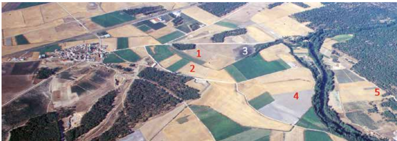
Vista aérea de la Zona Arqueológica Pintia. 1. Necrópolis de Las Ruedas. 2. Posible santuario. 3. Ustrinum de Los Cenizales. 4. Ciudad de Las Quintanas. 5. Barrio alfarero de Carralaceña (Sanz, 2010).

han tomado como suya la tarea de salvaguardar este singular bien patrimonial declarado Bien de Interés Cultural en 1993.