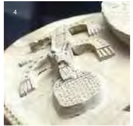
Torques de plata con nodus herculeus del tesoro núm. 1 de Las Quintanas de Pintia (1) y detalle del mismo (2) que podría estar imitando la iconografía del “zoomorfo en perspectiva cenital” representado en piezas como el broche de cinturón áureo (3) del tesoro núm. 2 de Arrabalde (Zamora) (según G. Delibes y A. Esparza), o la vasija de almacenamiento (4) recuperada en Roa de Duero (Burgos), la vieja Rauda .

se encuentran en el mundo helenístico y faltan claros nexos ibéricos, podría disiparse, en alguna medida, de ser interpretados como representaciones igualmente de animales en perspectiva cenital, a cuya mirada y percepción sin duda los vacceos y sus vecinos estarían más acostumbrados que nosotros. Para su introducción desde el ámbito mediterráneo al interior peninsular se ha valorado, aunque con reservas, el mundo púnico, desde Gadir donde el motivo, que no su asociación al torques, se documenta a partir del culto que mantuvo la ciudad en el templo dedicado al Hércules gaditano. Esta vía alternativa al mundo helenístico podría cobrar mayor peso ahora que en Pintia hemos hallados piezas como la cuenta de collar del Jano bifronte de la tumba 144 o el colgante-amuleto consistente en un figura de un personaje togado, de pasta vítrea verdosa, recuperado superficialmente. Así pues, sobre el motivo de un nodus herculeus importado, los vacceos realizarían su propia interpretatio , visualizando el característico animal en perspectiva cenital; ello justificaría el arraigo de este tipo de torques en la Meseta, con ocho ejemplares frente al único de Menjíbar en Andalucía, considerado incluso este préstamo meseteño.