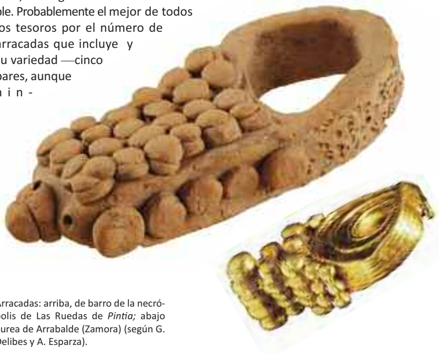
Arracadas: arriba, de barro de la necrópolis de Las Ruedas de Pintia ; abajo áurea de Arrabalde (Zamora) (según G. Delibes y A. Esparza).

En suma, hemos visto diversos objetos de orfebrería que tienen sus equivalentes en otros metales no nobles, ya sean el bronce o el hierro, y cuya cronología nos remite a los siglos II-I a.C., fechas que tradicionalmente han sido las barajadas para la orfebrería meseteña. Pero también hemos presentado tres piezas de cerámica, inéditas hasta ahora, que imitan diferentes tipos de joyas áureas. Imitación que se concreta en aspectos formales, pero también decorativos, aludiendo ya sea a la filigrana —mediante una serie de trazos incisos oblicuos en los zarcillos, o multitud de finas y desordenadas impresiones frontales en las arracadas—,