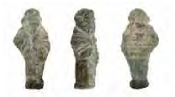
Colgantes en pasta vítrea de Pintia : sobre estas líneas un personaje togado hallado superficialmente en el poblado de Las Quintanas; a la izquierda abalorios elipsoidales junto a un cuenta polícroma de Jano bifronte, de la tumba 144 de Las Ruedas

o al granulado característico —con pequeños botones o perlititas aplastadas, a veces superpuestas dos a dos, éstas presentes en los tres tipos de joyas de barro, aunque especialmente en la arracada—.