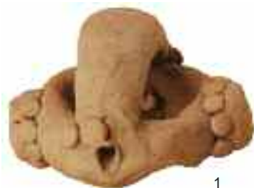
Diversos modelos de Fíbula Anular Hispánica: en cerámica (1), procedente de la tumba 153 de la necrópolis de Las Ruedas de Pintia ; en bronce (2), de la tumba 31 de Miraveche (Burgos); en plata con recubrimiento de chapa y filamentos áureos (3), de San Martín de Torres (León).

La cronología baja de estas producciones, acorde al proceso de conquista romana para la zona, no debe llevarnos a confundir el contexto de ocultación de estos tesorillos, con su génesis y más que probable herencia de generación en generación. En este sentido, el atavismo del modelo queda perfectamente de manifiesto en la consideración del peculiar y exclusivo sistema de ensamblaje de anillo y puente en este modelo. En el ejemplar de San Martín de Torres la pérdida de la chapa áurea de recubrimiento de esa