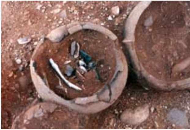
Urna cineraria de la necrópolis de Las Ruedas.