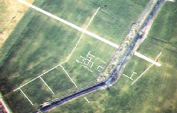
Las Quintanas. Fotointerpretación del área del foro y el cardo .

mero elevado de fustes de columna– se define una gran edificación que, por su tamaño y configuración espacial, no parece viable identificar con una serie de viviendas. Ello, unido a su privilegiada situación en un área central de la ciudad, permite incidir en la posible identificación del lugar con el foro de la Pintia romana.