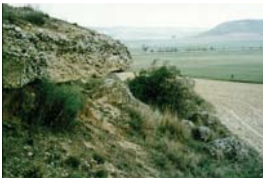
Cerro de Pajares, Padilla de Duero.

individuos infantiles a veces se nos muestran objetos miniaturizados, verdaderas jugueterías, como en el caso de la tumba 90 recogida en este catálogo. El paisaje simbólico de la muerte sirve en gran medida, y paradójicamente, para la reconstrucción social del mundo de los vivos, en tanto en cuanto existe una cierta dialéctica entre uno y otro mundo que traslada, en forma de personalidades y rangos, aquellos papeles –sexual, de edad, condición, etc– que desempeñaron en vida los pobladores de Pintia .