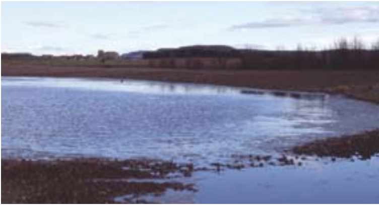
Laguna frente a las entradas suroccidentales de Las Quintanas, en el invierno de 2001.

basureros, derivadas de las actividades cotidianas del núcleo habitado, entre las que cabe mencionar las obras urbanas o los desechos. No obstante, allí donde se han desarrollado actuaciones arqueológicas, ha podido observarse reiteradamente que tales espacios se corresponden con zonas habitacionales –presencia de elementos constructivos, suelos, etc.–, por lo que parece lógico suponerlos arrabales o barrios extramuros.