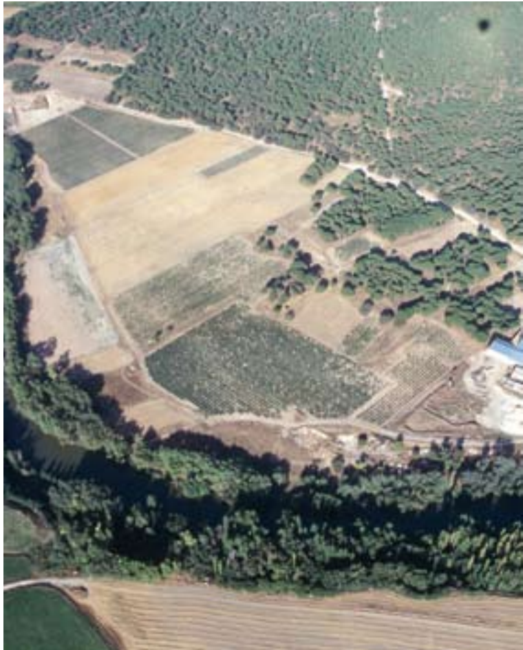
Vista aérea del barrio artesanal de Carralaceña, Pesquera de Duero, Pintia .

No obstante, no todos los muertos estarían recogidos en este cementerio. Al ritual normativo de la cremación, aplicado a la generalidad de los individuos, debemos contraponer otros rituales diferenciales: el de la inhumación bajo las viviendas de los menores sin dientes, y el de la exposición a los buitres según testimonio de Claudio Eliano para los vacceos, compartido este último por los celtíberos, según nos recuerda Silio Itálico, entre cuyas cerámicas también encuentra confirmación mediante algunas iconografías pictóricas. En Pintia a los niñitos les encontramos efectivamente bajo los pavimentos de algunas viviendas, y en cuanto al ritual expositivo, si bien es cierto que no tenemos datos directos, algunos argumentos podrían traerse aquí para pensar que efectivamente así se procediera cuando el guerrero moría en combate: la presen-