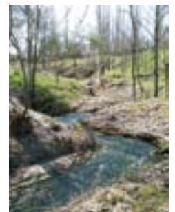
Arroyo de La Vega en las inmediaciones de su desembocadura en el Duero, Padilla de Duero.

La ciudad de los muertos, la necrópolis de las Ruedas, se sitúa a unos 300 m al sur del recinto amurallado y separado de éste por el arroyo de La Vega. Este espacio sepulcral fue objeto de