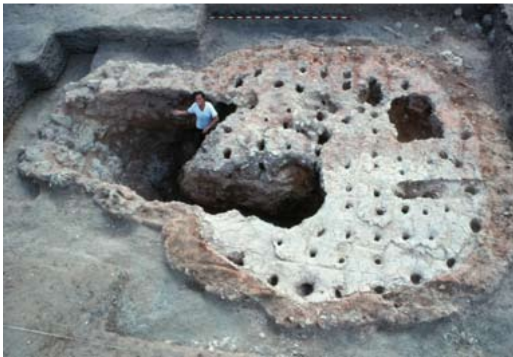
Horno número 2 de Carralaceña, Pesquera de Duero, Pintia .

te su precisa interpretación, si bien de tener en función de los elementos señalados, y a modo de hipótesis, cabría proponer su identificación con un santuario similar a los constatados en otros contextos europeos; pero eso es algo que sólo podrán desvelar futuras excavaciones.