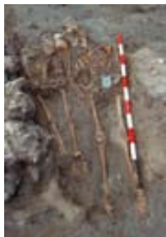
Las Quintanas. Inhumación doble infantil visigoda, s. VII d. C.

Las excavaciones posteriores, iniciadas entre 1988 y 1989, serían el germen de las realizadas en la actualidad que centran su acción, desde 1998, en una trinchera de 8 por 56 m. En este espacio tan limitado quedan condensados, en poco más de cuatro metros de potencia estratigráfica, tres horizontes culturales: visigodo,