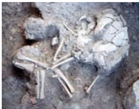
Las Quintanas, inhumación de un niño bajo el suelo de una vivienda.