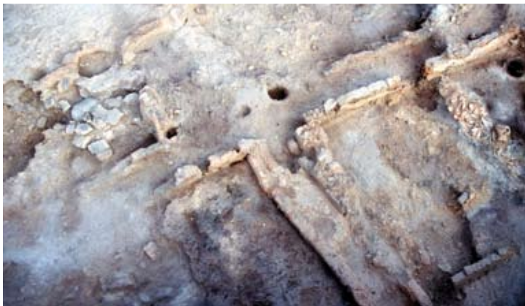
Las Quintanas. Detalle de pasillo medianil entre las traseras de las casas.

tar que la romanización llevara aparejadas transformaciones del suficiente calado como para afectar, no únicamente al urbanismo, sino también a la funcionalidad desempeñada por determinados sectores de la urbe.