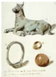
Acuarela de J. Martí Monsó (1872), depositada en la Real Academia de Bellas Artes de San Fernando, Madrid.

consideraciones. Su vinculación cronológica a los conflictos sertorianos, en los que otras ciudades vacceas como Pallantia o Cauca , Palenzuela (Palencia) y Coca (Segovia), respectivamente, se vieron inmersas, podría ser un marco adecuado para su construcción; su traza parecería responder a mano romana en la consideración de su marcado carácter rectilíneo, así como por el material constructivo empleado de mampuesto trabado con barro –bien distinto del utilizado en la tradición indígena–. Por último, la aparente presencia de un foso ciñendo la cara norte del lienzo, rápidamente colmatado, plantea si este muro se edificó para defensa de la ciudad o más bien como elemento de asedio. Una excavación de detalle sobre el lugar podría aclarar cuestiones tan interesantes como la génesis, utilidad y duración de la enigmática obra.