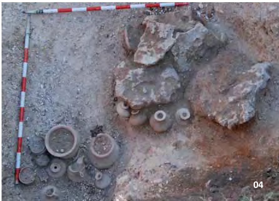
04 Tumba 127a y 127b in situ. Se trata de un conjunto doble sincrónico de una niña de corta edad y una mujer adulta datable hacia el final del siglo II a.C.